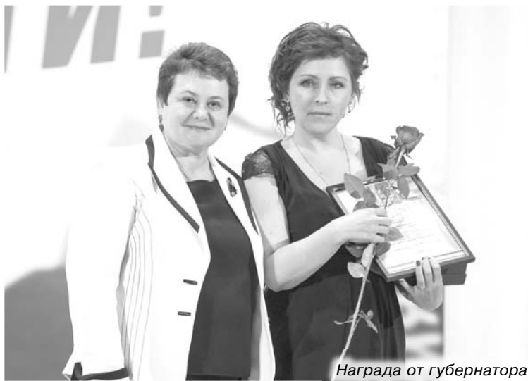
Награда от губернатора