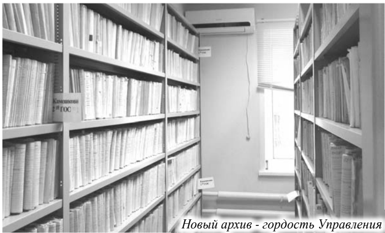
Новый архив - гордость Управления