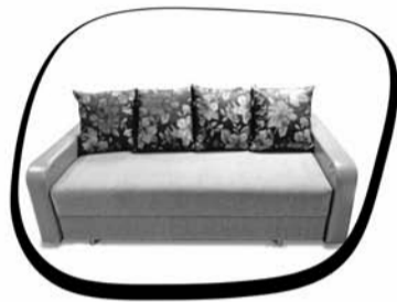
Диван-кровать (еврокнижка) «ФАНТАЗИЯ-3-6Н» 2200X1050 мм спальное место 1850X1350мм 21.400 14.990