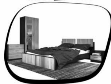
Спальный гарнитур «ФЛЕР» 21.900 14.990