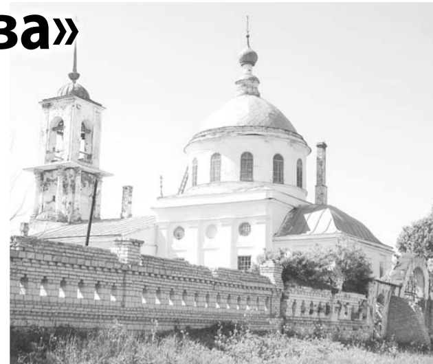
Храм в с. Горки