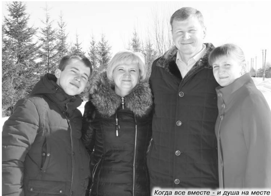
Когда все вместе - и душа на месте

Во Владимирской области Курганские с нуля на-