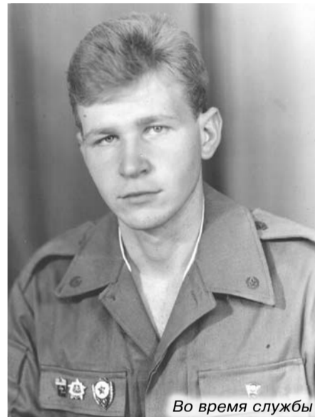
Во время службы