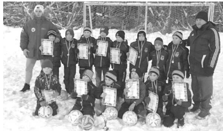
По материалам отдела спорта

По итогам многочасовых футбольных баталий турнира коверинцы стали четвертыми. Третьи места в своих возрастных группах у «Ютекс 2» и «Металлиста». Команды ФК «Труд» из пос. им. М. Горького стали вторыми. Победители соревнований – ФК «Ютекс» и ФК «Ютекс 1».