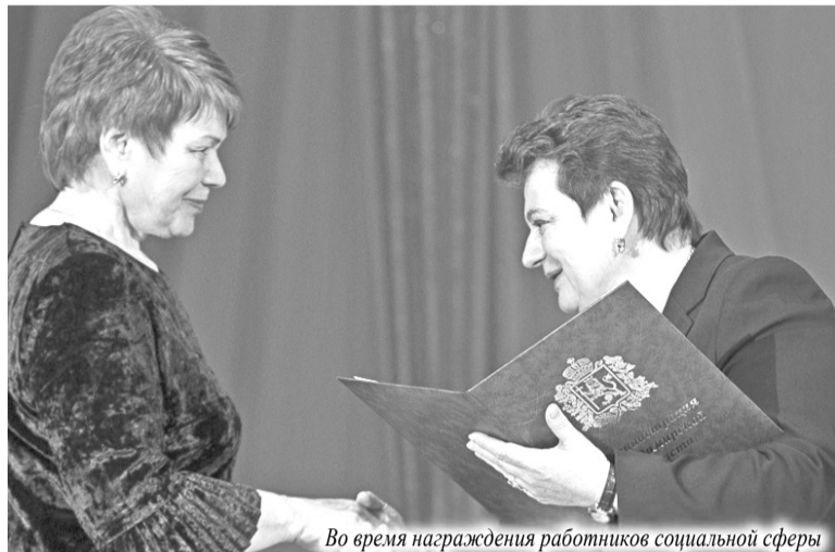
Во время награждения работников социальной сферы

В отношении семей, где появился второй или третий ребенок, запущена специальная программа ипотечного кредитования. Особое внимание уделяется вопросам детства. Например, по инициативе Светланы Орловой в последние годы значительно