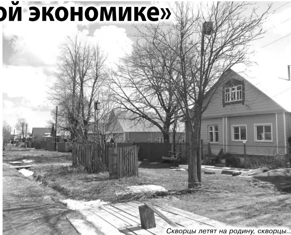
Скворцы летят на родину, скворцы...

ием заболочена, подъездов к ним нет. Когда ранее случались пожары, воду всегда брали исключительно в гидрантах на фабрике, а это в экстренной ситуации - потеря драгоценного времени. Обустроить подъездные площадки к прудам у местного населения не хватает ни сил, ни средств. Диву даемся: сейчас даже в самых глухих и малонаселенных деревнях жители проявляют инициативу, вплотную занимаются обустройством подъездных путей, а тут такая беспечность. Вероятно, деревенские привыкли долгие годы жить «под крышей» фабрики, с участием которой решались и многие бытовые проблемы. Но сейчас-то иные времена, помощи ждать бесполезно, так как давным-давно всю «коммуналку» предприятие передало местному самоуправлению. Так что спасение возгорающих – забота самих возгорающих.