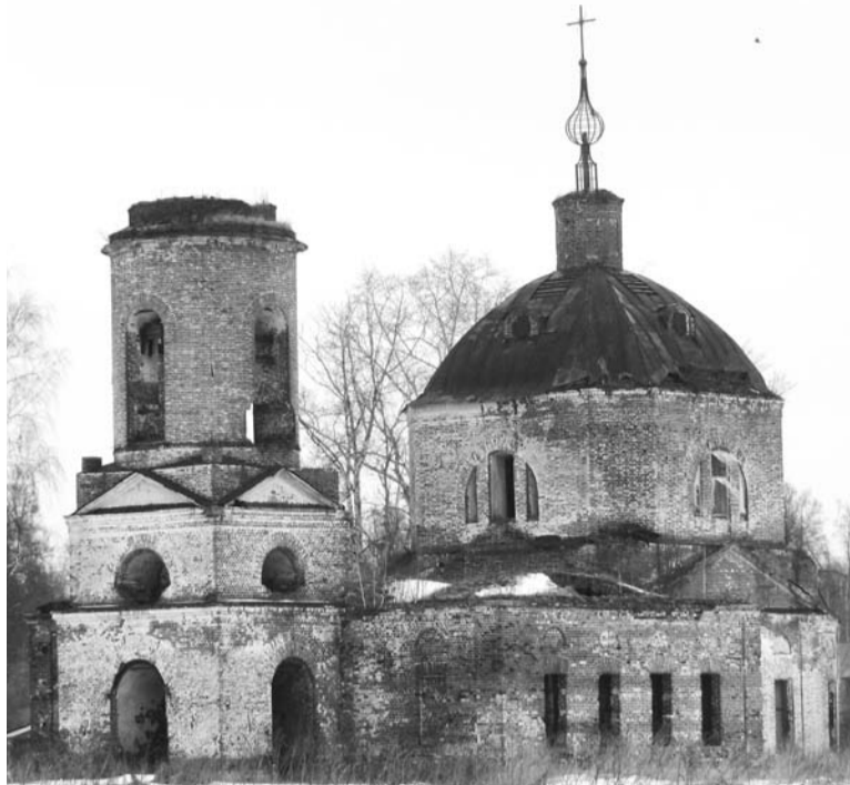
Храм в с. Лаптево выдержал даже... танковый натиск