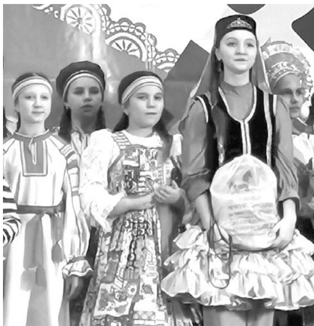
пломант I степени; «Русский танец (областные и региональные особенности)» - средняя группа ансамбля с танцем «Развесёлый перетоп» - дипломант I степени;