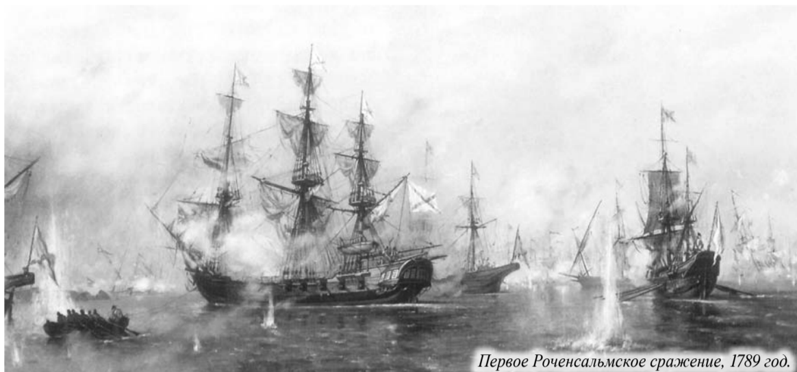
Первое Роченсальмское сражение, 1789 год.