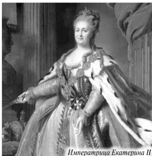
Императрица Екатерина II