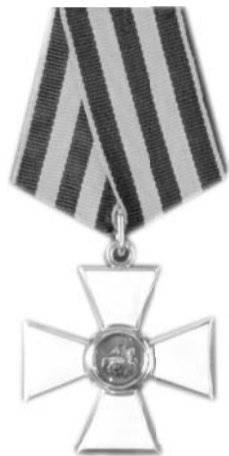
Орден св. Георгия Победоносца IV степени