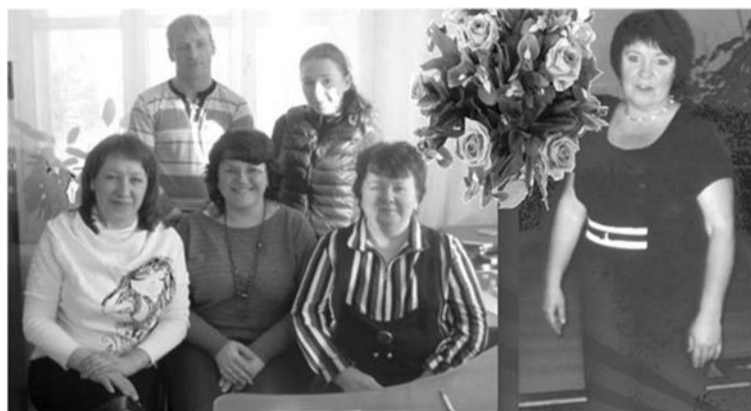
Современный коллектив ДК