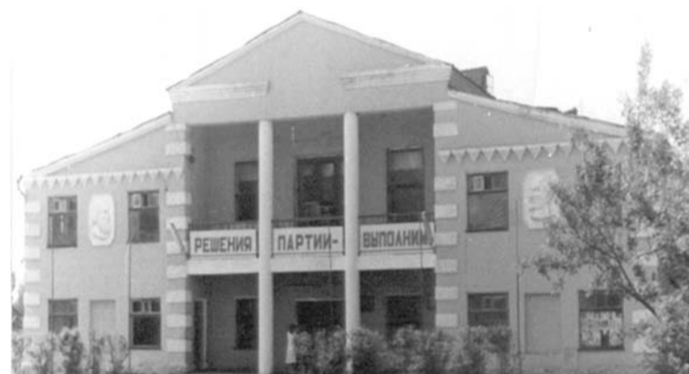
ДК пос. им. Горького, 70-е годы