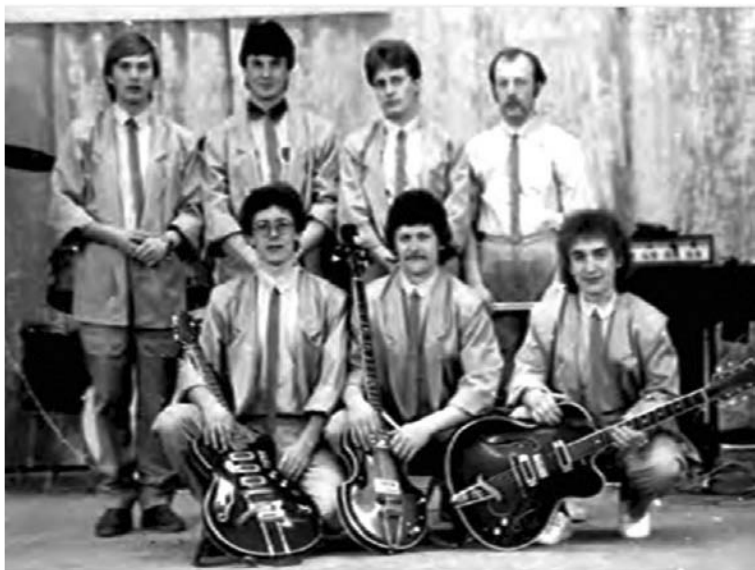
ВИА «Поворот», 1973 год