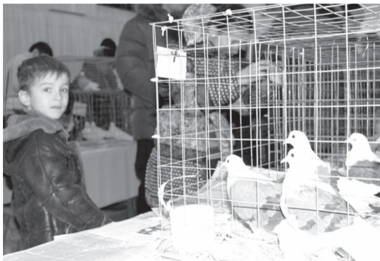
Не волнуйся ты моя, сизая голубка...

«владимирских чистых» вывели голубеводы-самородки более 400 лет назад. Эта порода послужила впоследствии для выведения кружастых всех разновидностей, которых в настоящее время насчитывается 14 видов. Родиной «чистых» является Владимирская и Ярославская области. Данную породу голубей отличает самобытный (а именно продолжительный, около трех часов) винтовой стиль полета «в завал». На сегодня в нашей области осталось всего несколько десятков особей. Пермский гривун тоже стал довольно редкой птицей.