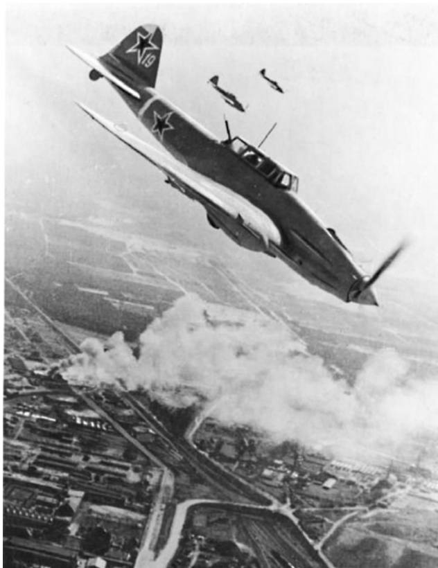
Хроника пикирующего истребителя

7 июля командир эскадрильи, будучи ведущим шести Як-7б, вылетел на