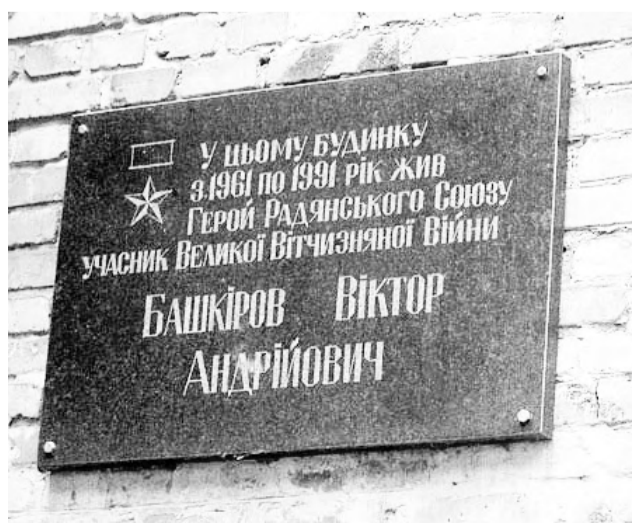
Мемориальная доска в честь нашего земляка в Чернигове