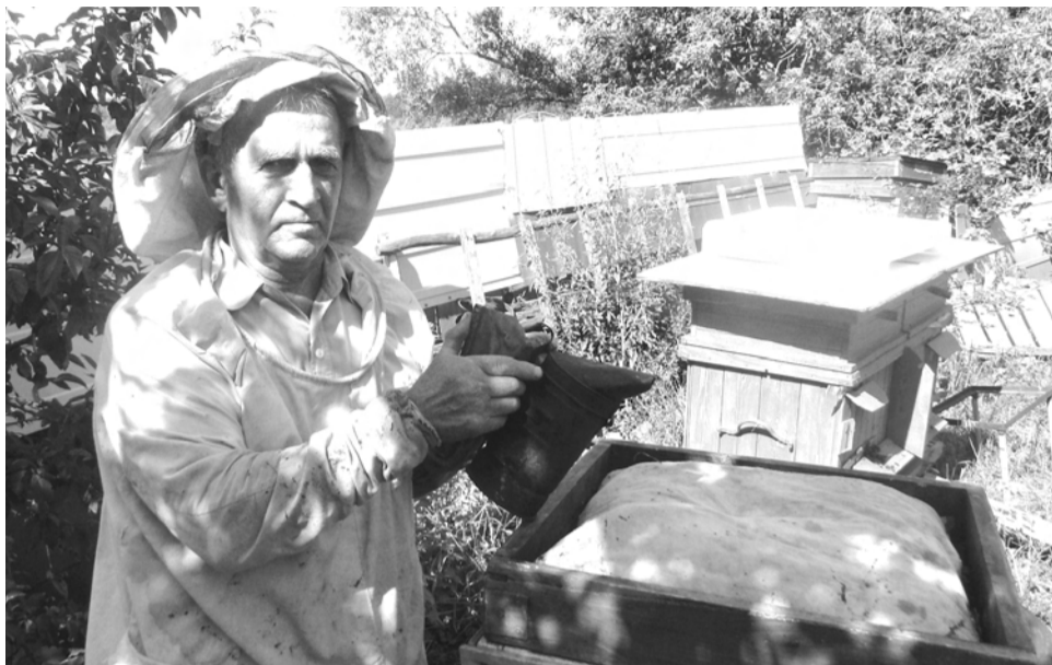
Пчел держать - не в холодке лежать

лективных хозяйствах Камешковского района существовали пасеки, но в начале 90-х все они приказали долго жить. А сколько было любителей пчел – Бог весть. Конечно, реформы не лучшим образом сказались на состоянии пасек. Главная из проблем, с которой столкнулись тогда пчеловоды – это сбыт продукции. Мед по разным причинам был вытеснен за черту продуктов первой необходимости. Тем не менее, постепенно пасеки возрождаются. И сегодня, когда «пластмассовая» еда уже всем изрядно поднадоела, спрос на мед очень вырос. Пчеловодство не только бизнес, для кого-то это страсть, для кого-то лекарство от недугов.