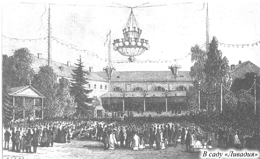
В саду «Ливадия»