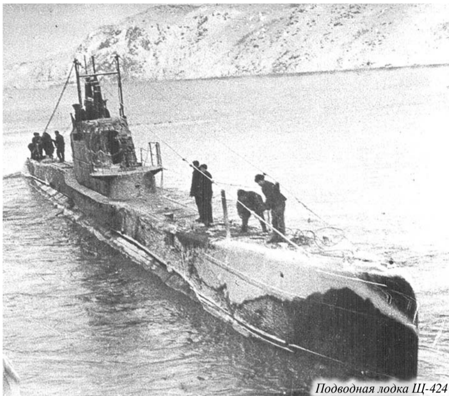
Подводная лодка Щ-424