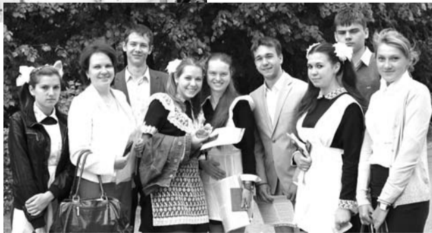
У ребят из Мирного настрой - на успех!

Экзамен длился 3 с половиной часа. Работа состояла из трех частей: в первой, которая содержит 30 заданий, ученики выбирали правильные ответы из нескольких предложенных вариантов, ответы на 8 вопросов второй части ребята формулировали самостоятельно, а третья часть