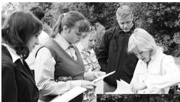
Школа №1: за полчаса до экзамена

В этом году Рособранзор ввел новые правила сдачи экзамена. Перед входом в ППЭ сотрудники полиции проверили выпуск-