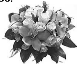
Жена, дети, зять, сноха, внуки

Любимый наш, считать не надо годы, Хоть их немало, все они полны Трудом, любовью и о нас заботой. Как низко поклониться мы должны Тебе за доброту твою и ласку! Тебя, наш милый, ценим, бережем. И твое сердце чутко, нежно, властно, Нас согревая, освещает дом!