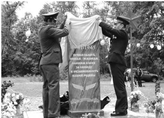
Новый обелиск в пос. им. Артема

Областной журналист мог не знать о местной программе реконструкции памятников, мог не найти времени, чтобы встретиться с главой МО, мог не задать нужные вопросы. Это вопрос профессиональной компетенции. Но как сами жители могли не знать о том, что происходит в их родном селе, остается загадкой.