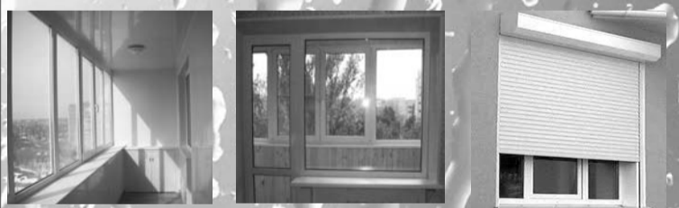
Лоджии с полной внутренней отделкой