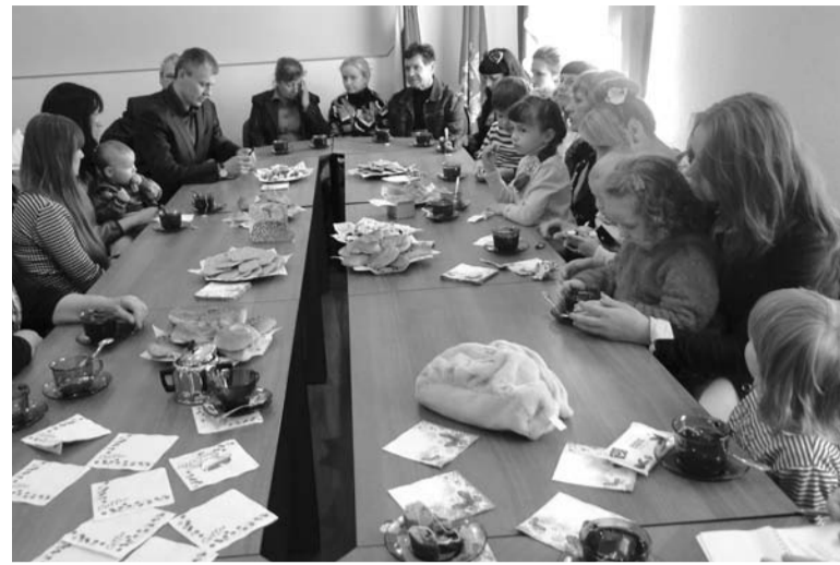
Пока шел взрослый разговор, дети налегали на сладости