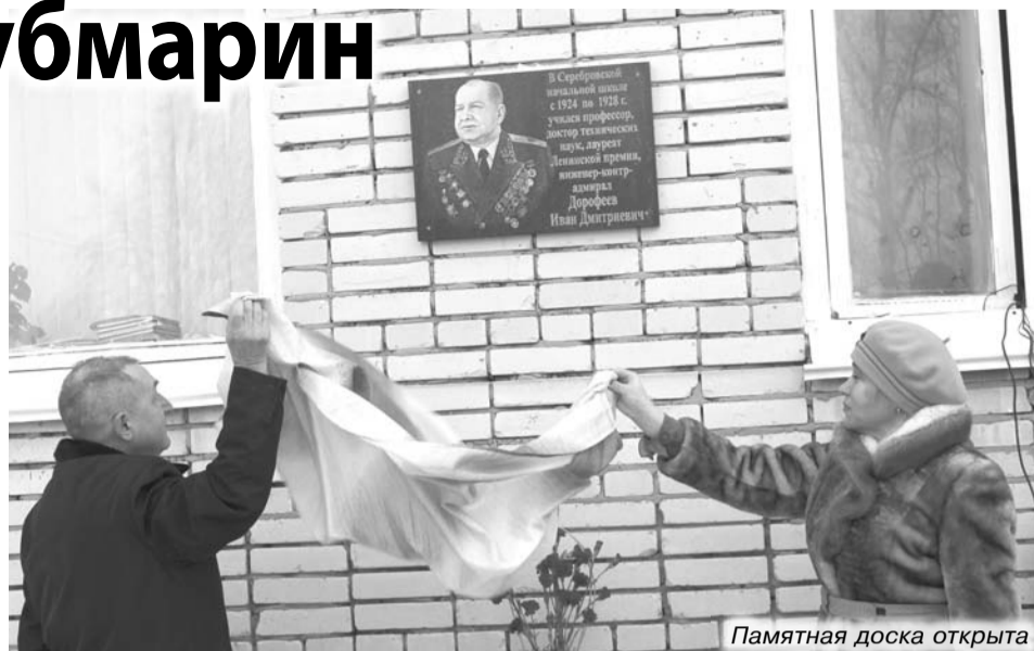
Памятная доска открыта