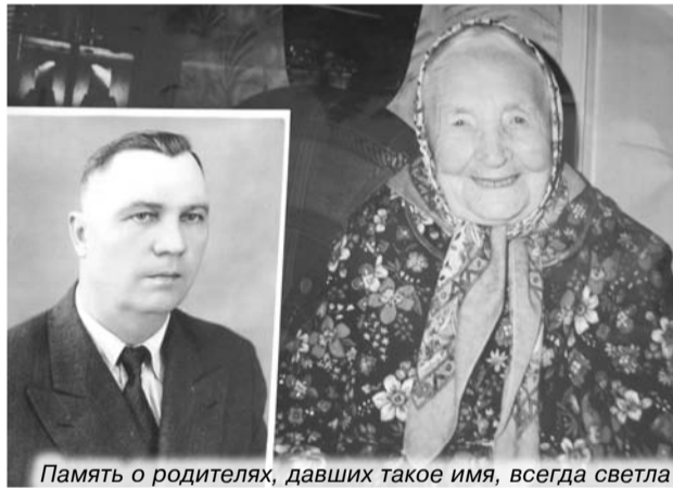
Память о родителях, давших такое имя, всегда светла