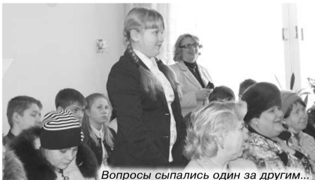
Вопросы сыпались один за другим...