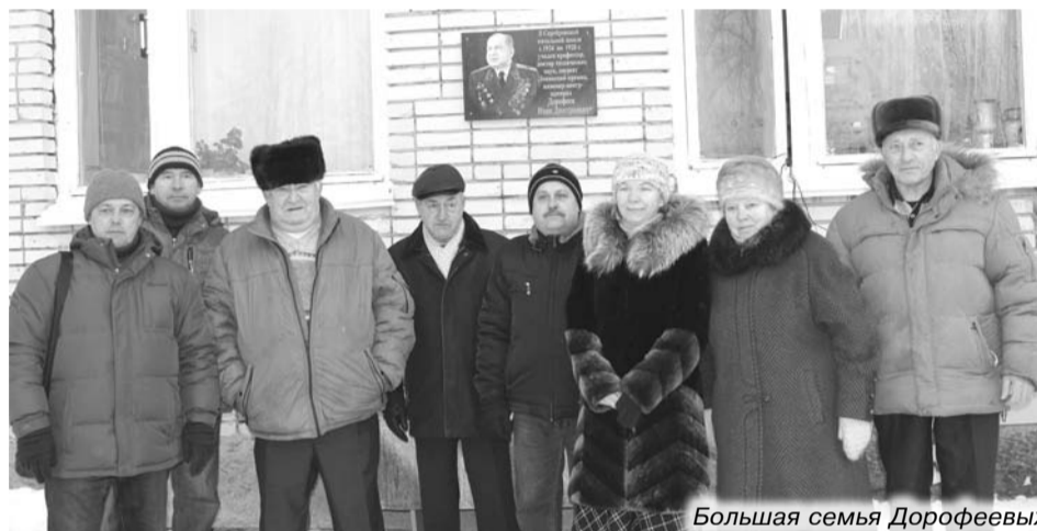
Большая семья Дорофеевых