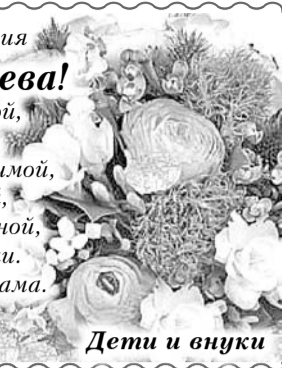
Дети и внуки

Будь самой веселой и самой счастливой, Хорошей, и нежной, и самой красивой. Будь самой внимательной, самой любимой, Простой, обаятельной, неповторимой, И доброй, и строгой, и слабой, и сильной, Пусть беды уходят с дороги в бессилии. Пусть сбудется все, что ты хочешь сама. Любви тебе, веры, надежды, добра!