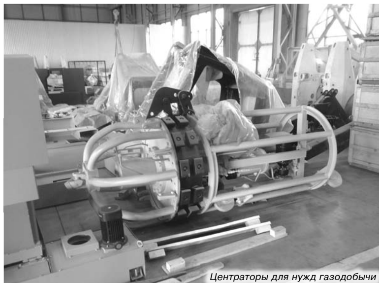
Центраторы для нужд газодобычи