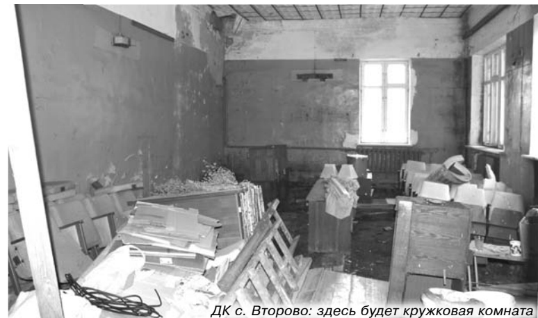
ДК с. Второво: здесь будет кружковая комната

В п. Мирный постоянно проживает свыше 970 человек, в школе поселка учится около 70. Молодежи не очень много, если сравнить с 80-ми годами прошлого века, когда в каждом классе Мирновской школы было по 30 учеников. Но нынешнее поколение отличается завидной активностью и стремлением к творчеству. «Не хлебом единым жив че-