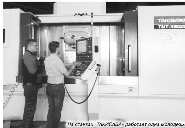
На станках «ТАКИСАВА» работает одна молодежь

ПРОШЛО уже 1,5 года, как на площадях бывшего МЭМЗа развернулось новейшее машиностроительное производство. На Камешковский механический пришла новая команда, сформированная под эгидой оборонного Ковровского электромеханического завода, который, как известно, в 2004 году специальным указом Президента РФ (№1009 от 04.08.2004 г.) отнесен к «стратегическим партнерам государства». В настоящее время камешковцы на своих площадях на 70% выполняют заказы именно этого предприятия, а оставшиеся 30% продукции расходятся «от Москвы до самых до окраин».