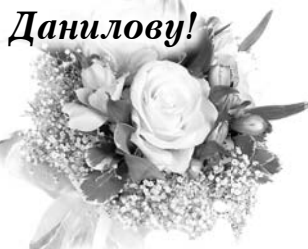
Твои дети и внуки

Тебе в юбилей говорим мы спасибо За теплое сердце и щедрость души, За то, что живешь ты на свете красиво, Что годы были твои хороши. И в свой юбилей ты прими поздравления, От сердца слова для тебя лишь одной. Пусть станут лучшие в мире мгновения Твоею прекрасной и яркой судьбой!