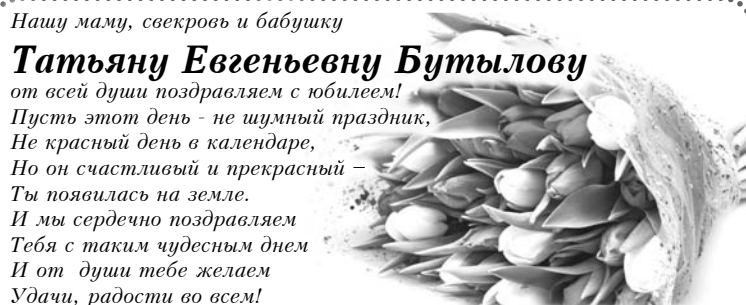
Сын, сноха, внуки

от всей души поздравляем с юбилеем! Пусть этот день - не шумный праздник, Не красный день в календаре, Но он счастливый и прекрасный - Ты появилась на земле. И мы сердечно поздравляем Тебя с таким чудесным днем И от души тебе желаем Удачи, радости во всем!