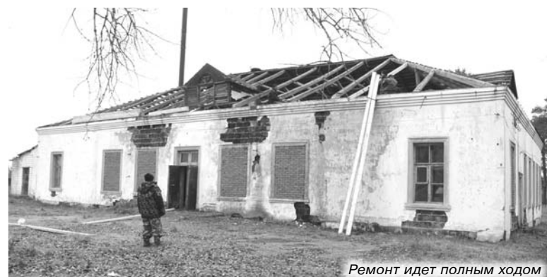
Ремонт идет полным ходом

В ЭТОМ году неожиданно для местных жителей на провалившейся крыше ДК п. Мирный закипела работа. «Продали клуб», - вздыхали одни. «Сносят развалюху», - качали головой другие. Нас тоже заинтересовала судьба поселкового Дома культуры, и мы выехали на место.