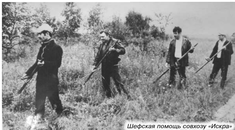
Шефская помощь совхозу «Искра»

ми экспонатами располагаются по всему периметру музея, свободного места уже почти нет.