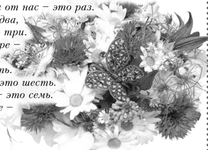
Коллектив ООО «Управдом»

В день рождения поздравления от нас - это раз. Шлем мы добрые слова - это два, Быть все время впереди - это три. Жить со всеми в дружбе, в мире - это, кажется, четыре. Никогда не унывать - это пять. Приумножить все что есть - это шесть. Быть внимательным ко всем - это семь. Быть всегда в нормальном весе - это восемь, девять, десять. Ну, а к этому в придачу - Счастья, радости, удачи!