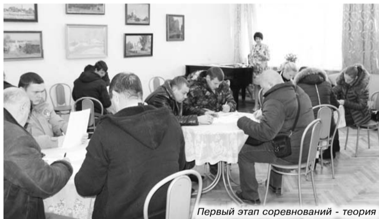
Первый этап соревнований - теория