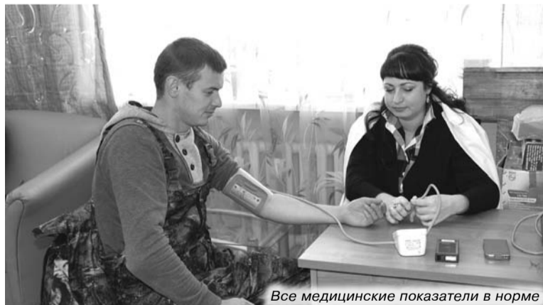
Все медицинские показатели в норме