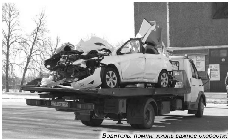
Водитель, помни: жизнь важнее скорости!