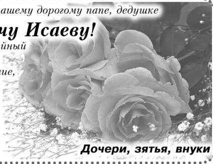
Дочери, зятя, внуки

В прекрасный праздник юбилейный Желаем мы от всей души, Чтоб было светлым настроение, Чтоб счастье озаряло жизнь. Улыбки теплые наполнили Всегда гостеприимный дом ... Желаем радости, гармонии, Благополучия во всем!