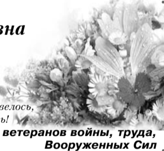
Члены районного совета ветеранов войны, труда, Вооруженных Сил

Поздравляем Вас с юбилеем и желаем Здоровья, тепла и добра. Чтоб бед, неудач отступила пора, Чтоб жить - не тужить до ста лет довелось, Пусть сбудется все, что еще не сбылось!