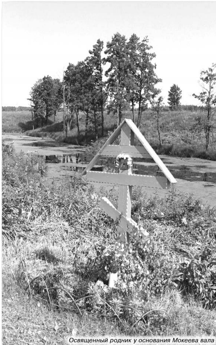
Освященный родник у основания Мокеева вала