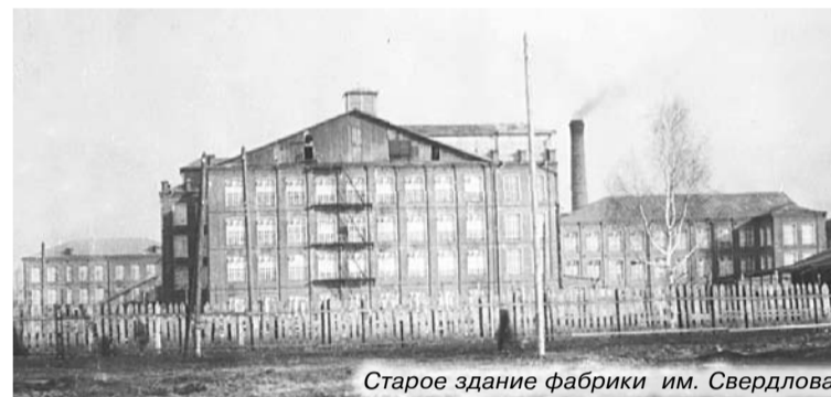
Старое здание фабрики им. Свердлова