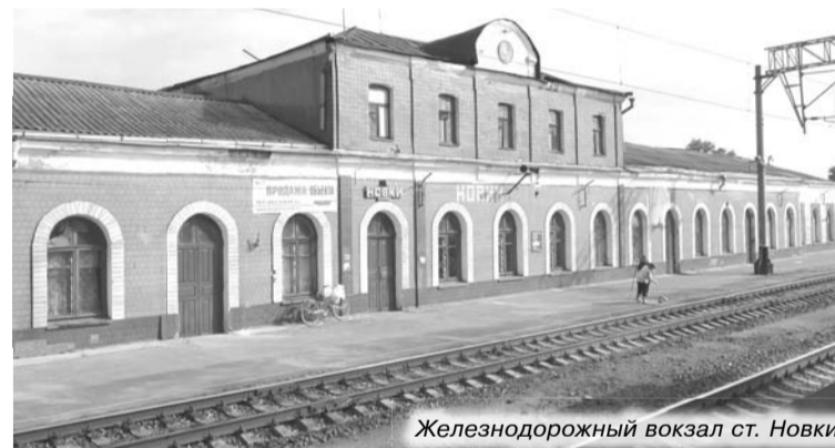
Железнодорожный вокзал ст. Новки

ве, Воскресенская церковь (1794) в селе Воскресенском, Троицкая церковь (1801) в Горках, Вознесенская церковь в городе Камешково (1906 г.), дворянская усадьба князей Грузинских-Шорыгиных в селе Михайловском, где по воспоминаниям современников гостил великий композитор Петр Ильич Чайковский.