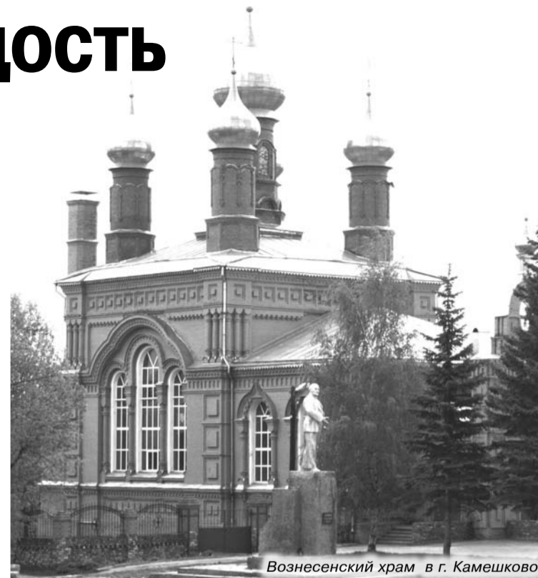
Вознесенский храм в г. Камешково

На нашей земле сохранилось немало жемчужин архитектуры XVII-XIX веков, в том числе храмы допетровской Руси: Всехсвятская церковь в селе Эдемское (1691 г.), Михаило-Архангельская церковь в с. Второво (1689 г.), а также Преображенская церковь в с. Давыдово с самой высокой в округе колокольней (1841 г.), церковь Николая Чудотворца (1872) в Кругло-