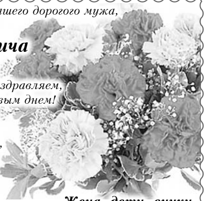
Жена, дети, внуки

Тебя мы с днем рождения поздравляем, С таким большим, счастливым днем! От всей души тебе желаем Благополучия во всем. Пусть годы мчатся чередой, Минуты все ценятся. Мы все желаем всей душой Любви, здоровья, счастья!