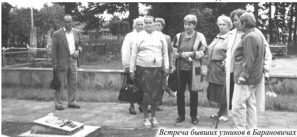
Встреча бывших узников в Барановичах