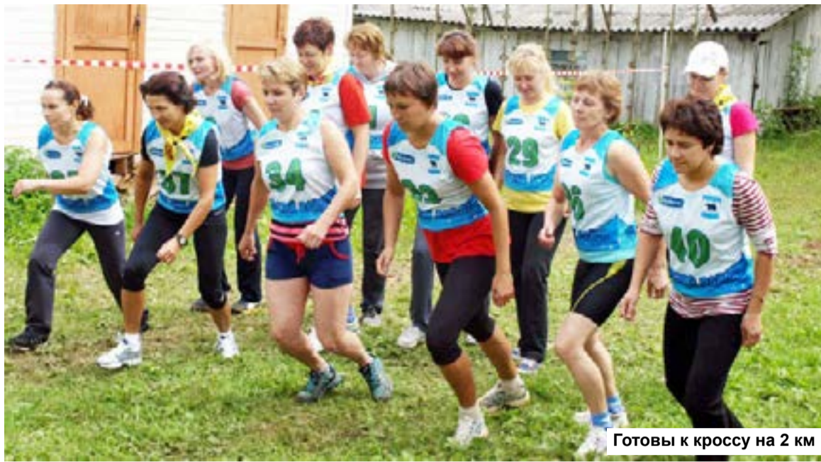
Готовы к кроссу на 2 км