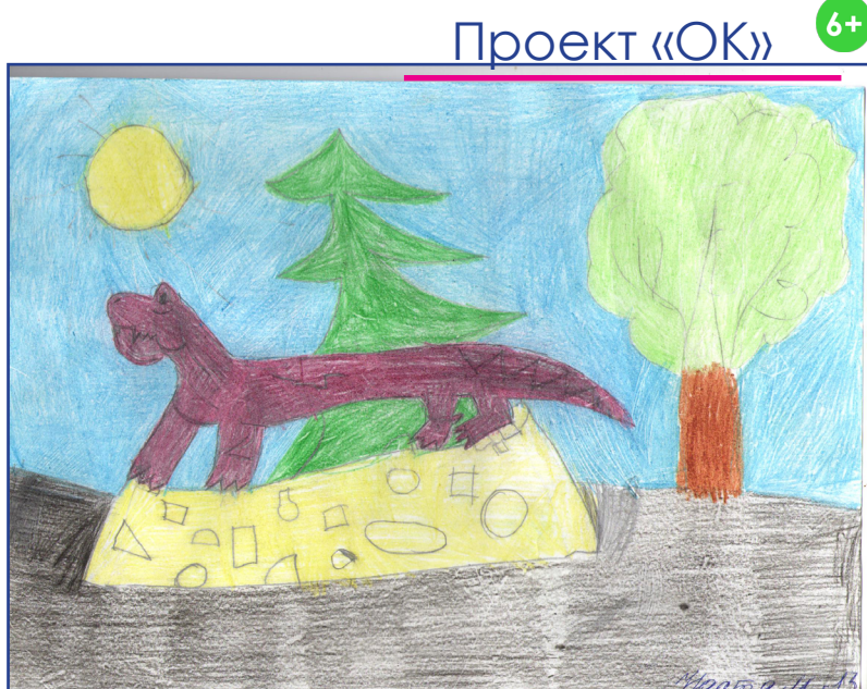
НАСТЯ МОКРУШИНА, 6 ЛЕТ: «Люблю Очёр, потому что недалеко от него нашли останки звероящеров, и теперь Эстик - мой друг».