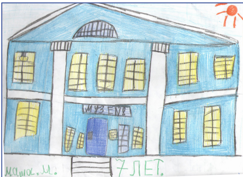
МАША МАЛЬЦЕВА, 7 ЛЕТ: «Люблю Очёр, потому что он очень красивый город, здесь красивая природа и здания, особенно Очерский музей и его залы, в нём очень интересно».