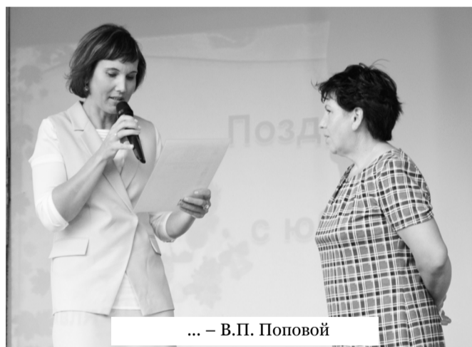
... – В.П. Поповой