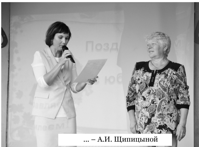
... – А.И. Щипицыной