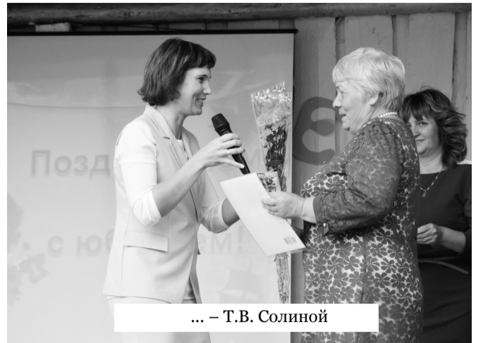
... – Т.В. Солиной