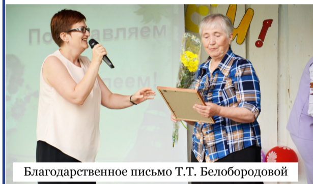
Благодарственное письмо Т.Т. Белобородовой