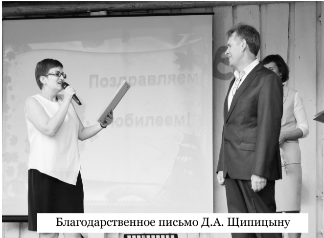
Благодарственное письмо Д.А. Щипицыну