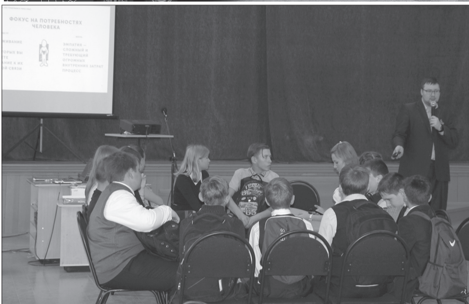
Ребята знакомятся с понятием промышленный дизайн

Когда «Кванториум» приезжает на место, большая часть оборудования выносится и размещается в школе. Ребята сначала занимаются на компьютерах, например, моделируют какие-то объекты, после этого отправляют задание на 3D-принтер в лаборатории, заряжают пластик и наблюдают, как их задумка воплощается в реальности.