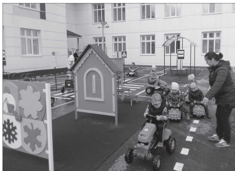
Дети с удовольствием играют в автогородке

Активно жители включились в разработку проектов, которые предстоит реализовать в 2020 году. Всего на конкурс от нашего района направлены 11 проектов. О том, какие из них станут победителями и будут реализованы мы обязательно расскажем нашим читателям.