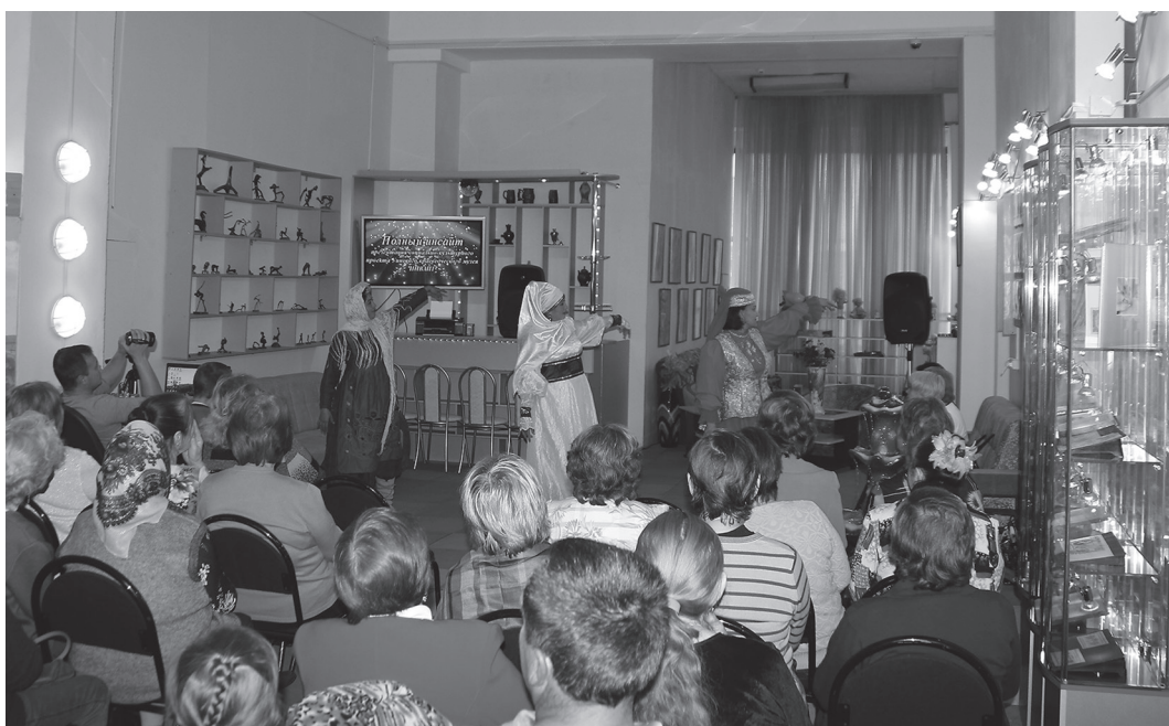
Презентация проекта «Инвайт» в Уинском краеведческом музее