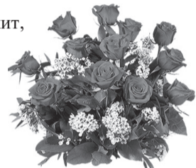
С/п жена, дети, внуки, правнучка

Каждый день, что вместе с нами прожит, Нежностью и радостью согрет! Пусть тебе любовь наша поможет Быть счастливым много-много лет. Знаешь, как чудесно нам с тобой, Пусть же у тебя, наш дорогой, Сбудется желание любое, Радости, удач тебе, родной!