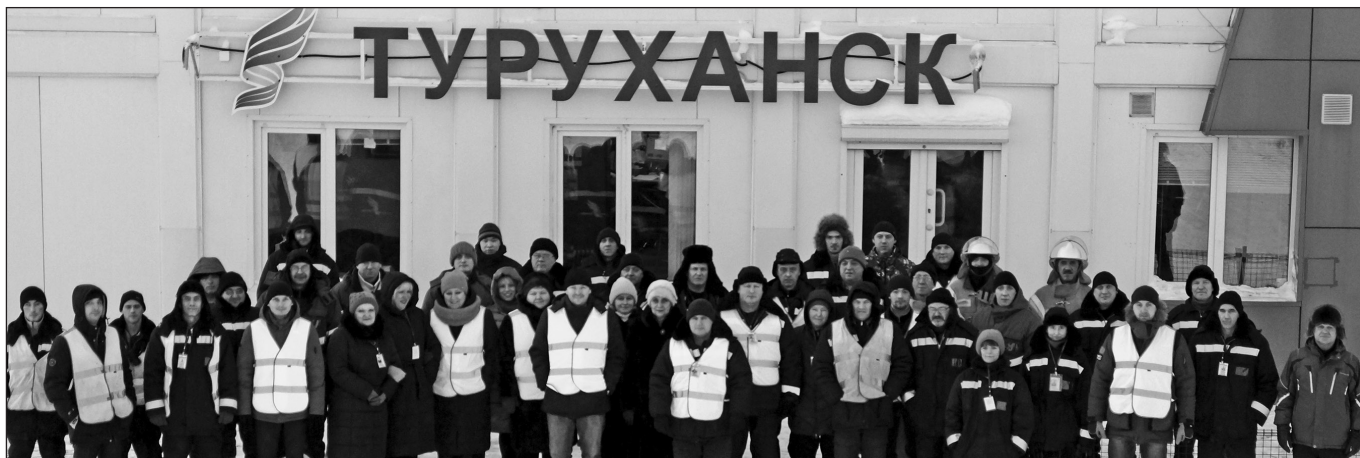
Кадры-решают все! Коллектив аэропорта.