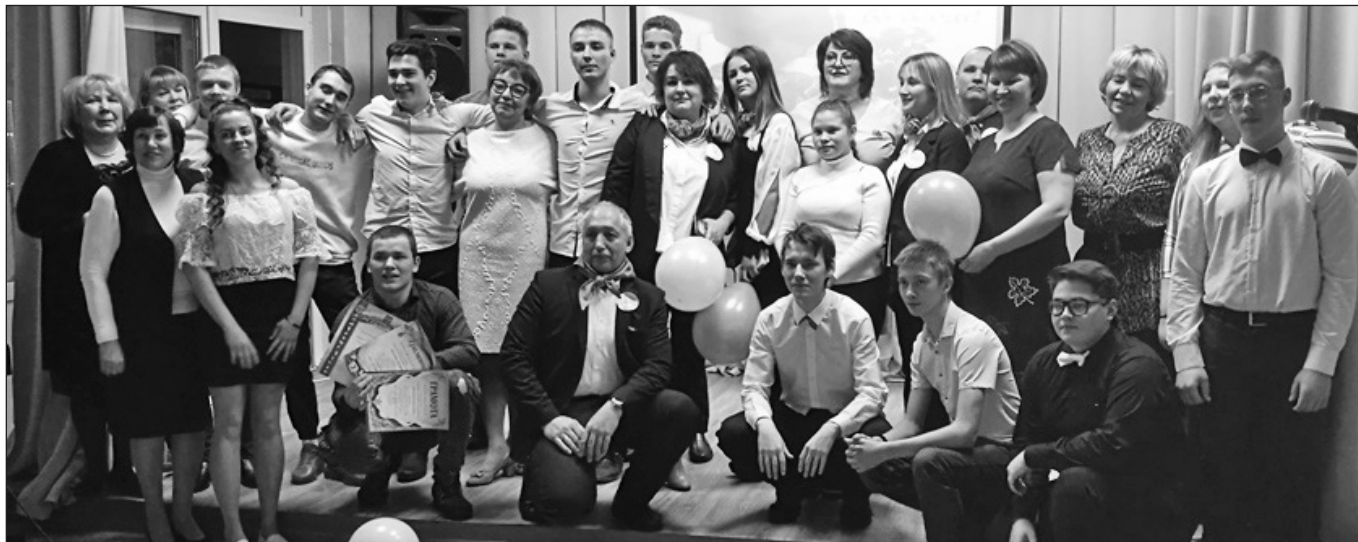
Игра проходила в теплой, дружественной обстановке, все участники старались принести очки своей команде, радовались и хлопали, узнав, что их ответ совпал с правильным.