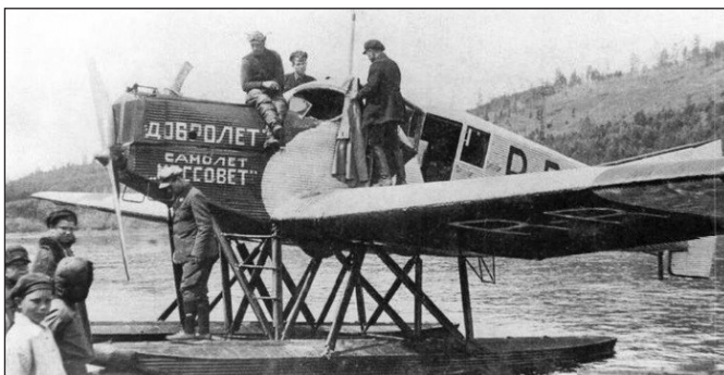
Первый в Туруханске самолет ЮНКЕРС F-13.

Важным в модернизации аэропорта является проведение капитальных ремонтов искусственных покрытий аэродрома. За прошедшие 8 лет на элементах летного поля произведена