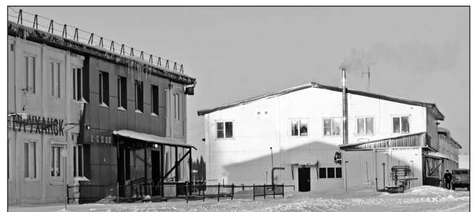
Новые здания служебно-пассажирского аэровокзала и гаража службы спецавтотранспорта.