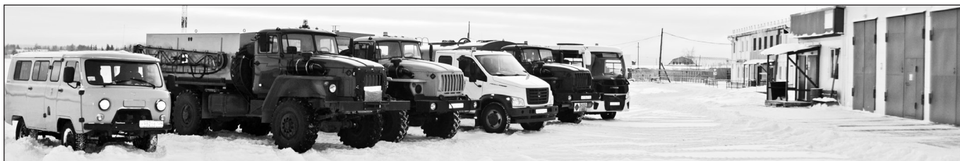
Новая спецтехника аэропорта.

» В перспективе возможно на регулярной основе принимать воздушные суда ATR 72-500, пассажироместность которых составляет до 74 человек.