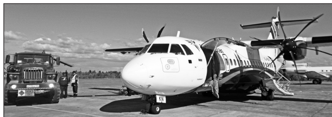
Наземное обслуживание воздушного судна ATR 42-500.

5 февраля 2020 года в г. Москва состоялась VI-я Национальная премия «Воз-