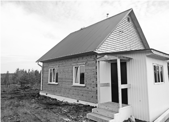
Новые дома появились на участках всего за полтора месяца.