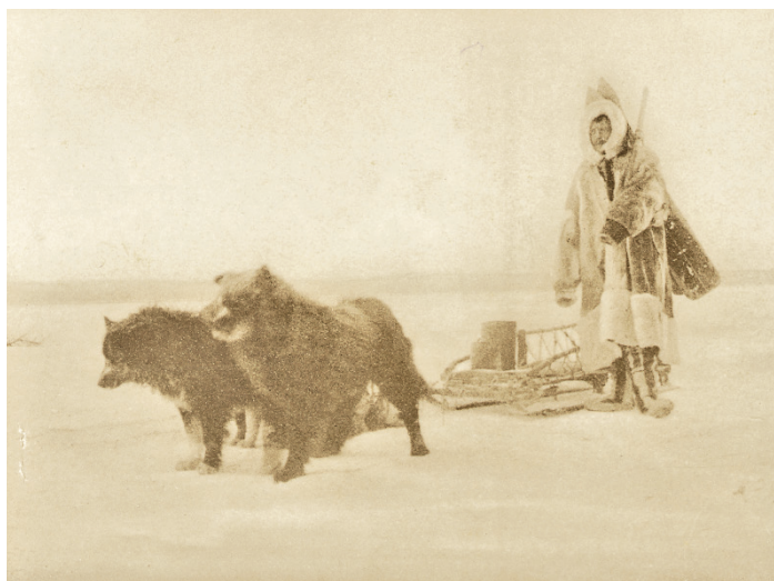
ИЗ БЫТА ЗАПОЛЯРНЫХЪ КОЧЕВНИКОВЪ СИБИРИ.