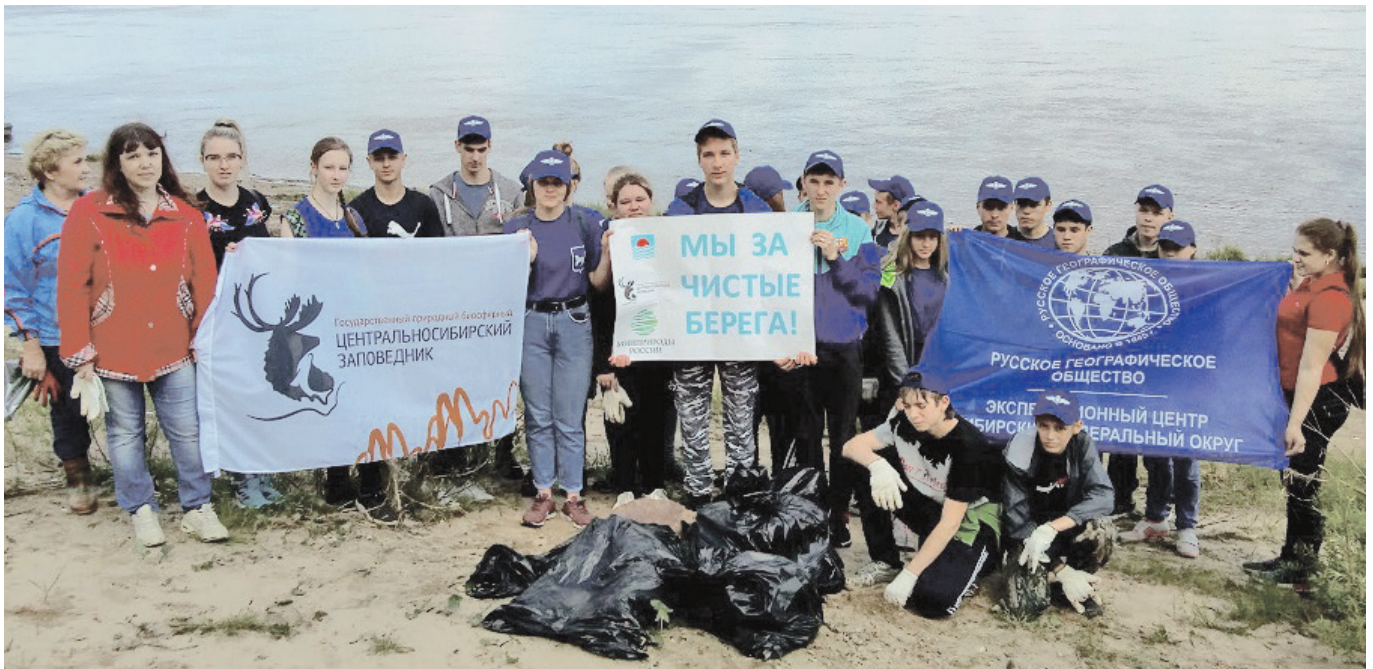
Члены Туруханского отделения РГО активно участвуют в акциях Русского географического общества