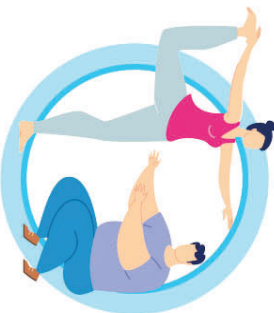
ВЕДИТЕ ЗДОРОВЫЙ ОБРАЗ ЖИЗНИ