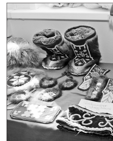
Выставка декоративно-прикладного искусства вызвала у гостей большой интерес.

Еще один подарок для жителей Советской Речки ко Дню Оленевода преподнесен администрацией Туруханского района и ОАО «Северные телекоммуникации»: в населенном пункте организована сотовая связь, со 100% покрытием, что заслужило особую благодарность у местных жителей. АП