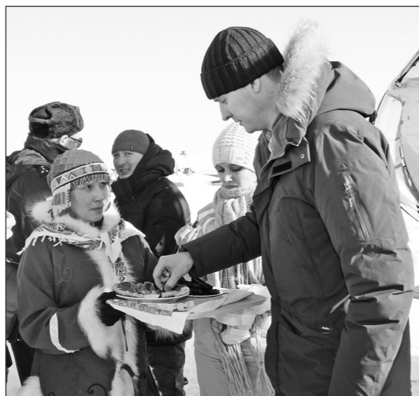
Гостей праздника встречали с хлебом, солью и ... мороженой печенью!