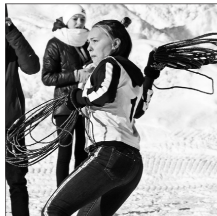
Метание тынзына требует невероятной меткости.