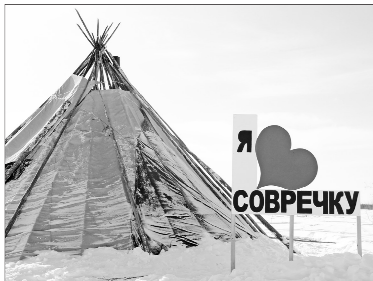
В гостевом чуме все желающие отведали северные угощения.