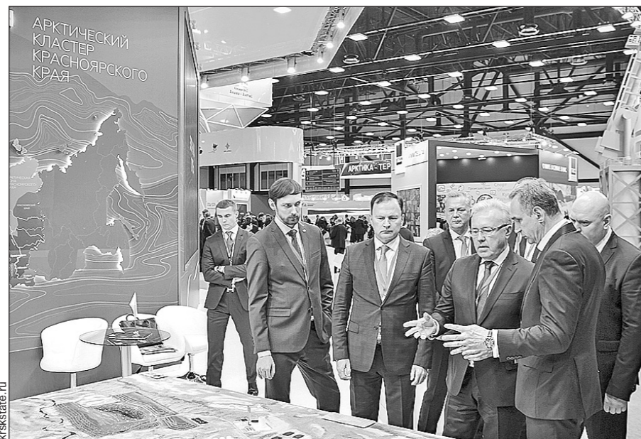
На арктическом форуме наш край представил экспозицию КИП «Енисейская Сибирь».

На этот раз краевая делегация, возглавляемая губернатором Александром УССОМ, представила экс-