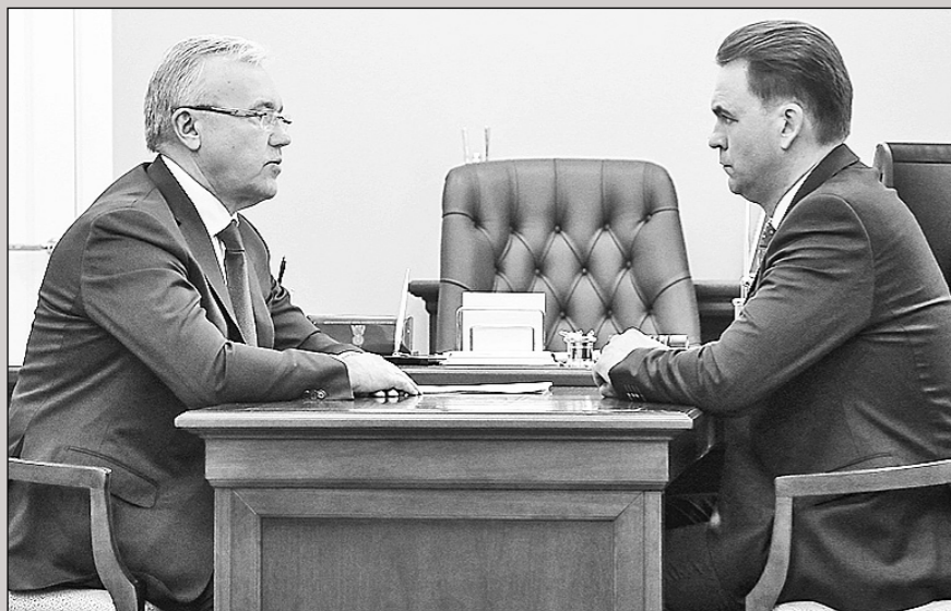
Рабочая встреча губернатора с новым министром экологии и рационального природопользования региона.

– Мы столкнулись с совершенно обоснованными жалобами населения. Они связаны с неорганизованностью и безответственностью лиц, которые должны эти задачи выполнять. Поэтому попрошу вас с первых дней обратить самое серьезное внимание на реформу. Надо сделать так, чтобы люди почувствовали пользу от этого процесса, – заявил Александр УСС. – Работы у вас и у вашего министерства очень много, я буду ждать от вас активной позиции как в решении стоящих перед ведомством задач, так и в выстраивании диалога с активистами-общественниками, жителями края, которые заинтересованы в том, чтобы экологическая ситуация менялась к лучшему.