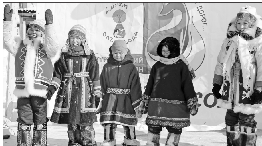
Юные артисты из поселка Советская Речка приветствуют гостей праздника.