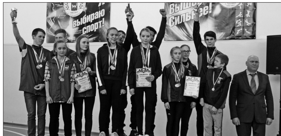
Команды из Фарково, Ворогово и Игарки заняли первые три места в общекомандном зачете.