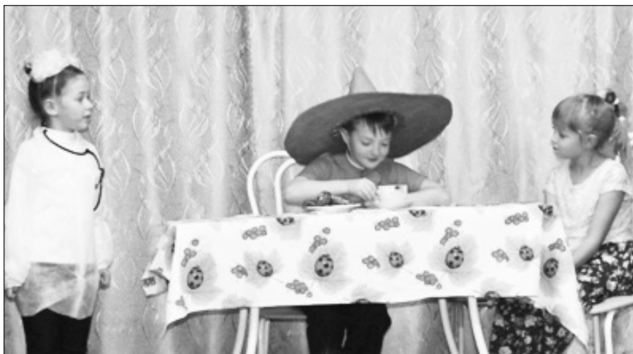
1,3 класс. «Приключение Незнайки и его друзей».