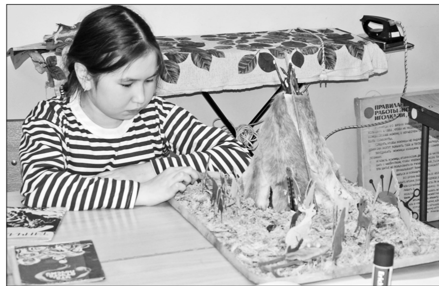
На мероприятии «Сказы северной тайги» ребята вновь узнали много нового.