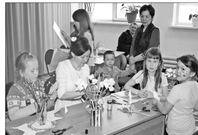
Большой восторг у детей вызвало рисование узоров на лицах.

Информация предоставлена администрацией Туруханского района.