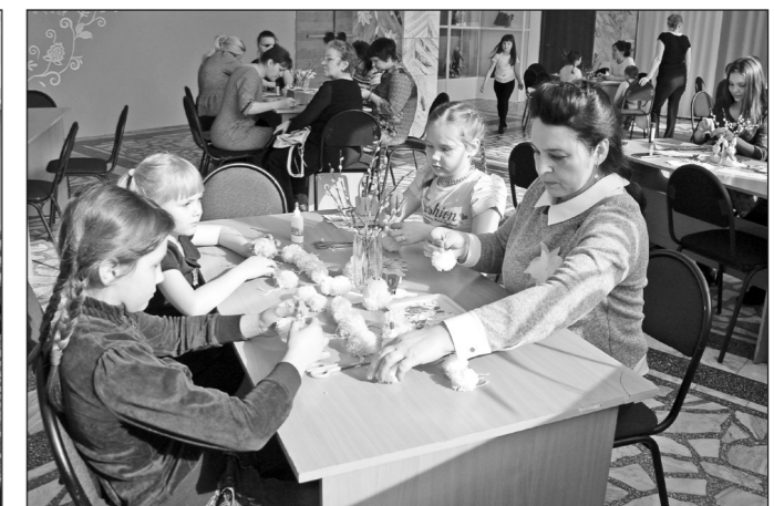
Мастер-класс – отличный повод поделиться своим опытом с маленькими гостями.