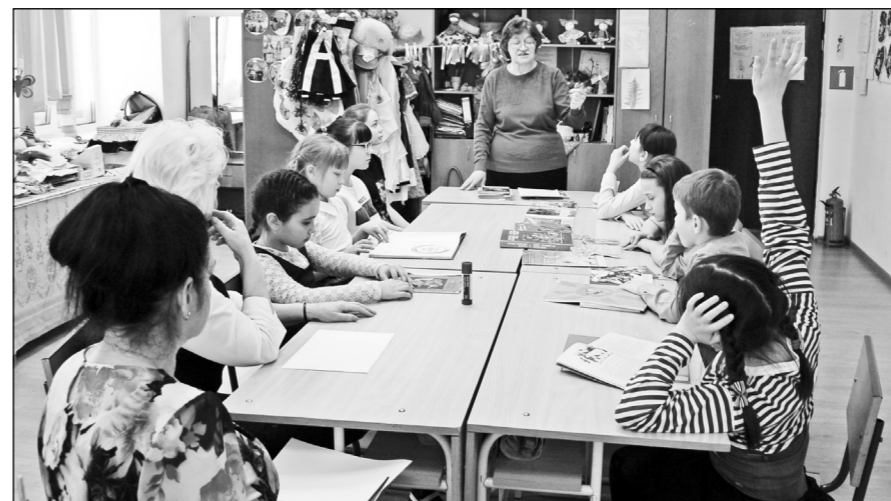
Встречи сотрудников детской библиотеки с участниками краеведческих проектов всегда проходят увлекательно.

Работа по реализации краеведческих проектов центральной районной детской библиотекой села Туруханск обязательно будет продолжена. Ведь подобные занятия пробуждают у детей интерес к книге, развивают чувство родного языка, обучают детей навыкам анализа художественного произведения, развивают воображение и эстетические задатки читателей. А не это ли является одной из основных задач детских библиотек?