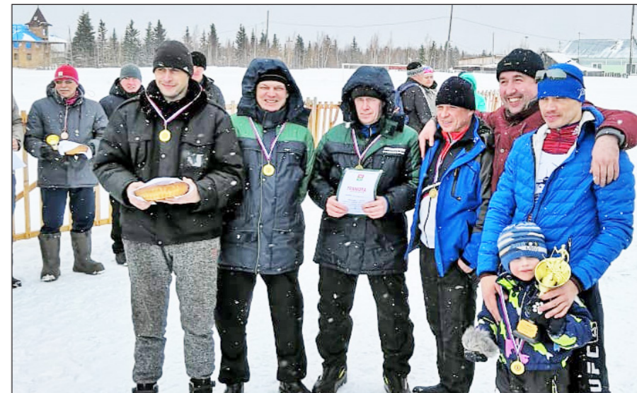
Команда Аэронавигации – победитель лыжной эстафеты.

После окончания эстафеты были подведены и оглашены итоги. Победу