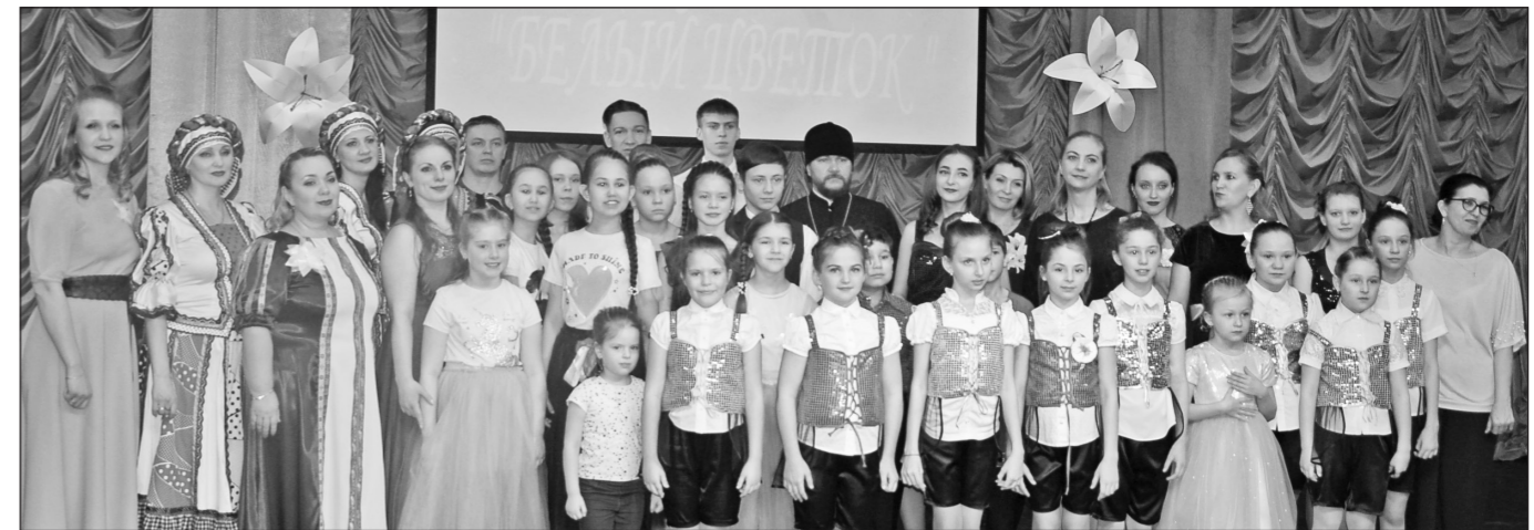
Творческие коллективы районного Дома культуры и детской музыкальной школы.