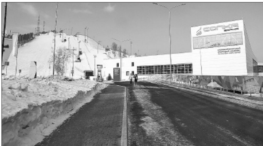
«Сопка» – чуть ли не единственный в мире комплекс, где одновременно можно проводить соревнования по шести дисциплинам фристайла. Он может стать международным учебным центром

миру и среде. Как пример – компания «Полюс Золото» переехала к себе на родину. Хотя у нее есть структурное подразделение не только в крае. На низком старте находится и РУСАЛ, который тоже намерен перевезти в Красноярск основной управленческий дивизион. Эту политику мы будем продолжать. Это означает и рабочие места, и социальные лифты для молодежи, это место управленческих решений. Очевидно, что «ты – мне, я – тебе» – такой тактики не может быть в отношениях с бизнесом.