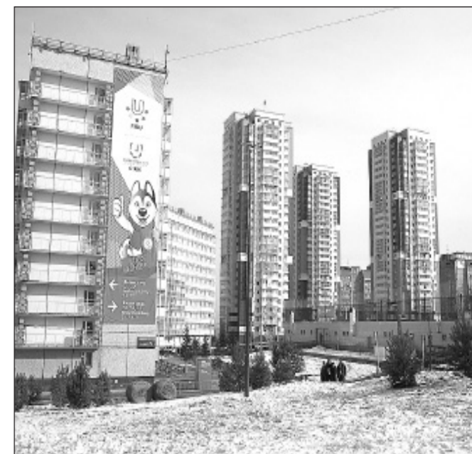
Была Деревня универсиады — стал современный, хорошо оснащенный кампус для студентов Сибирского федерального университета.