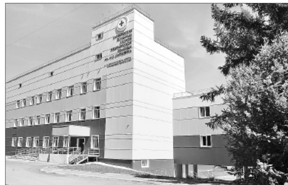
Система здравоохранения региона приросла несколькими больничными корпусами.

– Важен материальный аспект: большое количество спортивных объектов появилось, произошли заметные инфраструктурные преобразования, начиная с аэропорта, Николаевского проспекта. Построены две больницы и многое другое