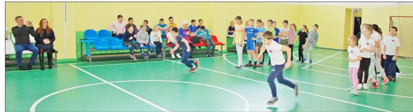
Команды «Россия» и «Комета» приступили к «Президентским состязаниям».

Во встрече приняли участие ветераны спорта и юные хоккеисты. Игра проходила в упорном, захватывающем противостоянии, команды показали свое мастерство и волю к победе. Зрители смогли увидеть настоящий хоккей – с непредсказуемостью счета, спортивным азартом и боевым настроем игроков, захватывающей динамикой игры и жесткостью схваток в борьбе за шайбу. Болельщики не могли сдержать эмоций, поддерживали свои команды «кричалками» и аплодисментами. Мероприятие было настолько зрелищным, что случайные свидетели останавливались и начинали с любопытством