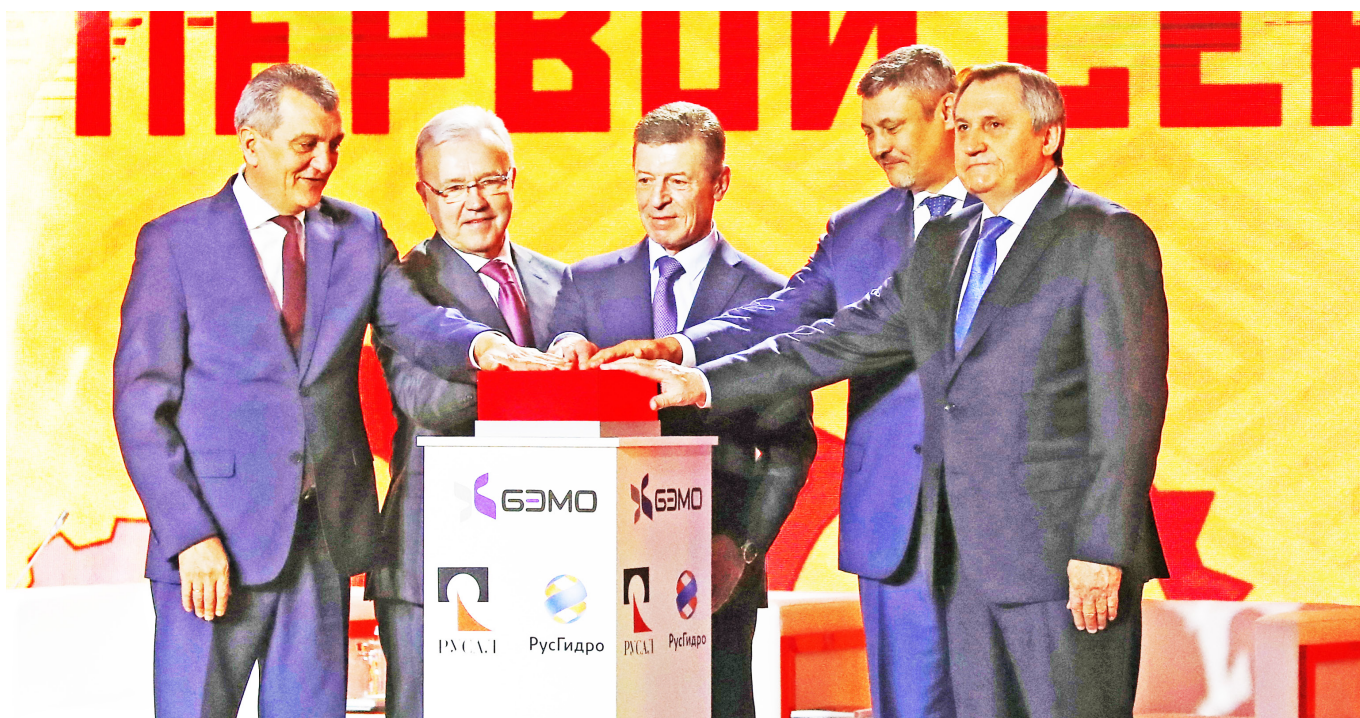
Запуск первого пускового комплекса на Богучанском алюминиевом заводе.