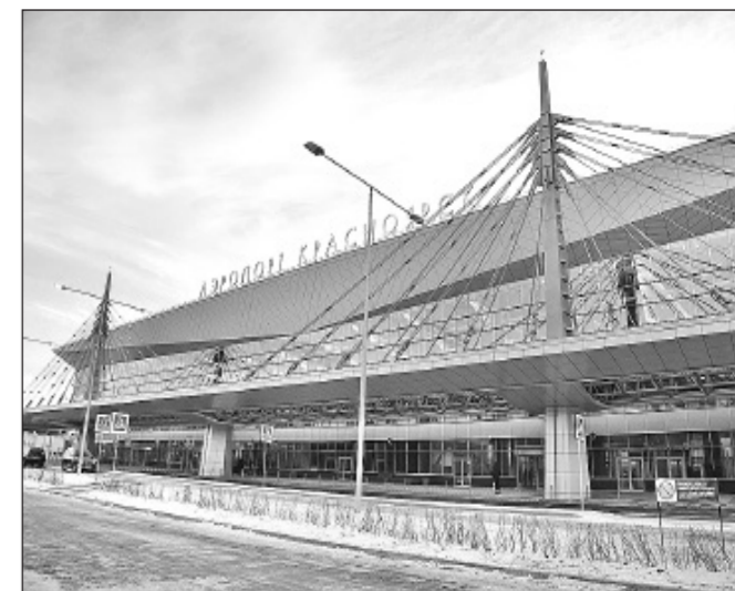
Обновленный красноярский аэропорт открывает возможности для экономического роста края.

Я пытаюсь и сейчас с таких позиций продолжать эту линию. Придет очередной КЭФ, будем дальше говорить о вкладе крупных корпораций в развитие края. С точки зрения того, что принято называть хозяйским отношением к окружающему