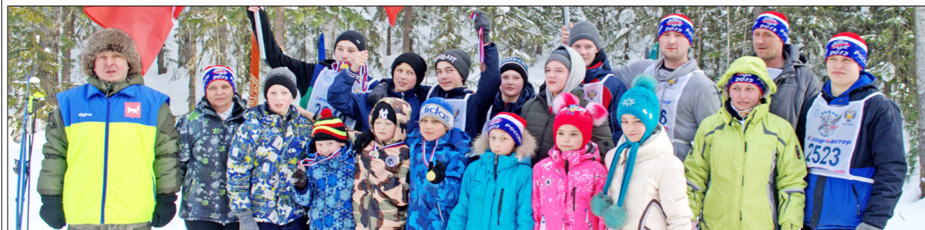
Участники забега «Лыжня России – 2019». «Бахта».

Материал предоставлен Отделом физической культуры и спорта администрации Туруханского района.