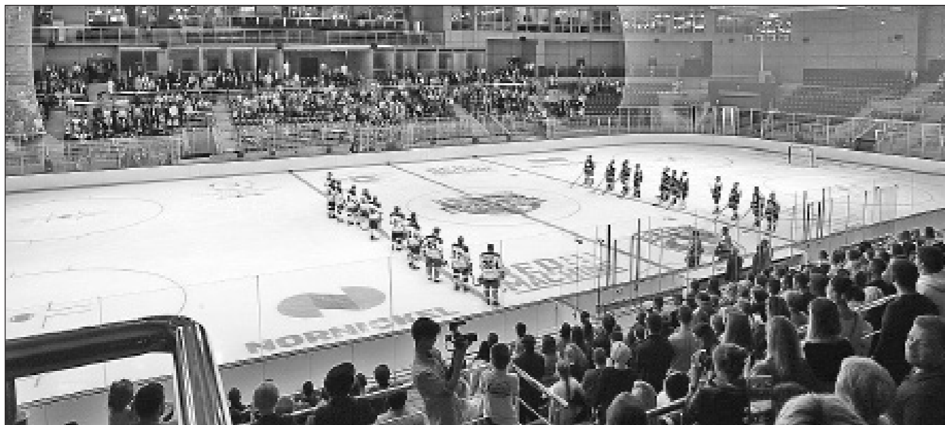
Новые спортивные объекты позволят готовить атлетов высокого класса и развивать массовый спорт.