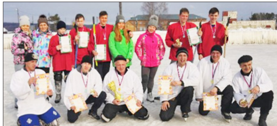
Во встрече приняли участие ветераны спорта и юные хоккеисты.

Во встрече приняли участие ветераны спорта и юные хоккеисты. Игра проходила в упорном, захватывающем противостоянии, команды показали свое мастерство и волю к победе. Зрители смогли увидеть настоящий хоккей – с непредсказуемостью счета, спортивным азартом и боевым настроем игроков, захватывающей динамикой игры и жесткостью схваток в борьбе за шайбу. Болельщики не могли сдержать эмоций, поддерживали свои команды «кричалками» и аплодисментами. Мероприятие было настолько зрелищным, что случайные свидетели останавливались и начинали с любопытством