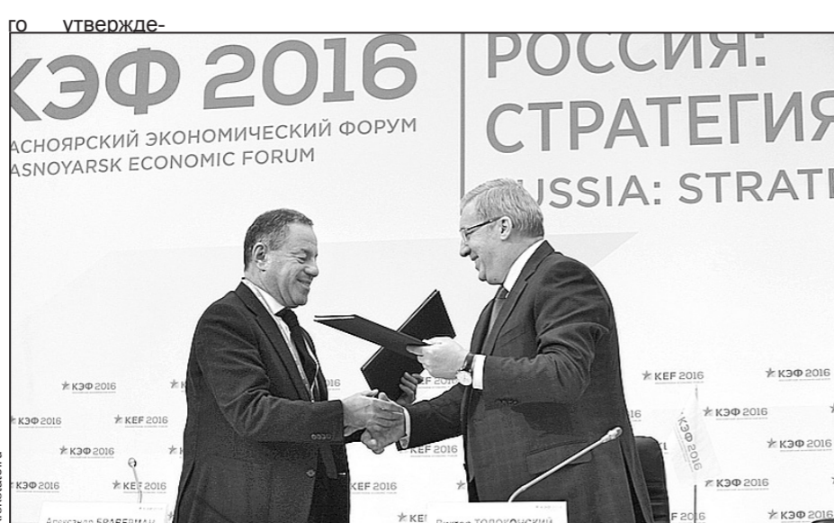
Подписание соглашения о сотрудничестве между Красноярским краем и АО «Федеральная корпорация по развитию малого и среднего предпринимательства».

Разумеется, участники всех дискуссий осознавали сложность сегодняшней экономической ситуации в стране. Мало кто обошелся без пессимистическо-