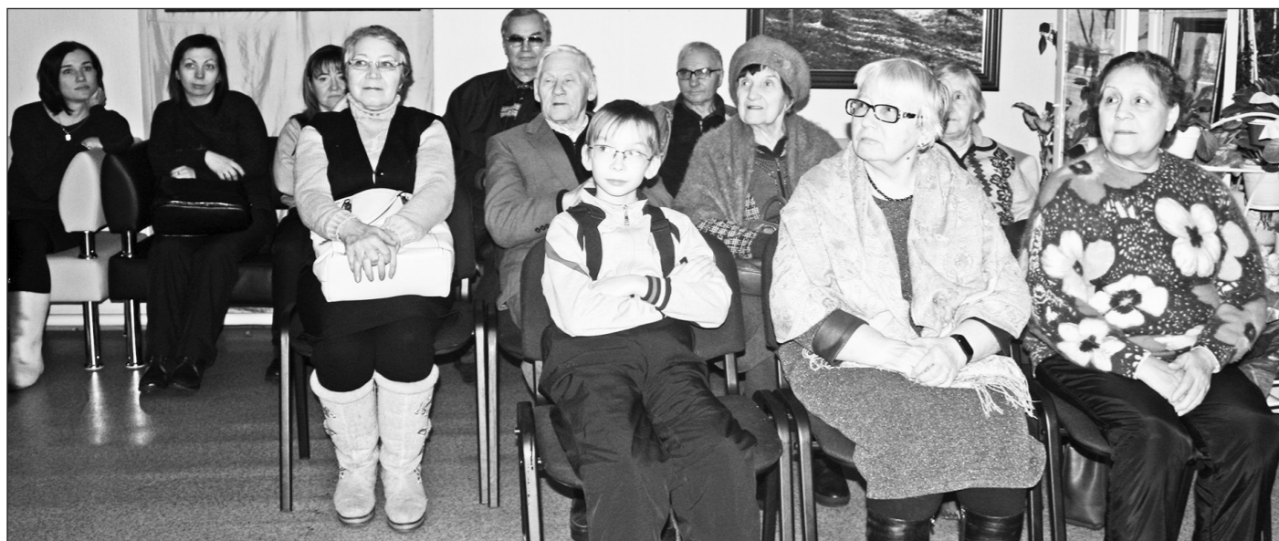
Гости с большим интересом знакомились с историческими событиями Туруханского района.