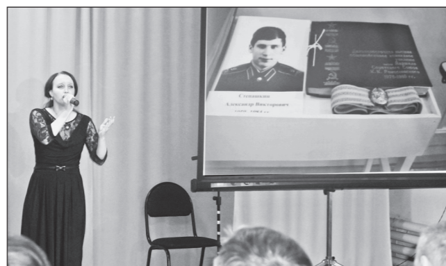
Вспоминали о солдатах, ушедших в Афганистан с туруханской земли.