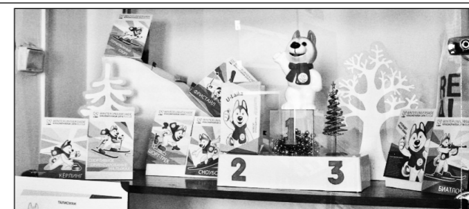
На выставке представлена сувенирная продукция и символика Универсиады-2019.

Универсиада – международные спортивные соревнования среди студентов, проводимые под эгидой Международной федерации студенческого спорта (FISU). Название «универсиада» происходит от слов «Университет» и «Олимпиада». В отличие от четырехлетнего олимпийского цикла, студенческие состязания проводятся каж-