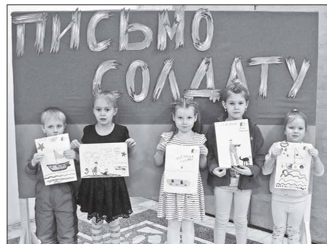
Ребята из досугового клуба «Ухтышки» тоже приняли участие в краевой акции «Письмо солдату».