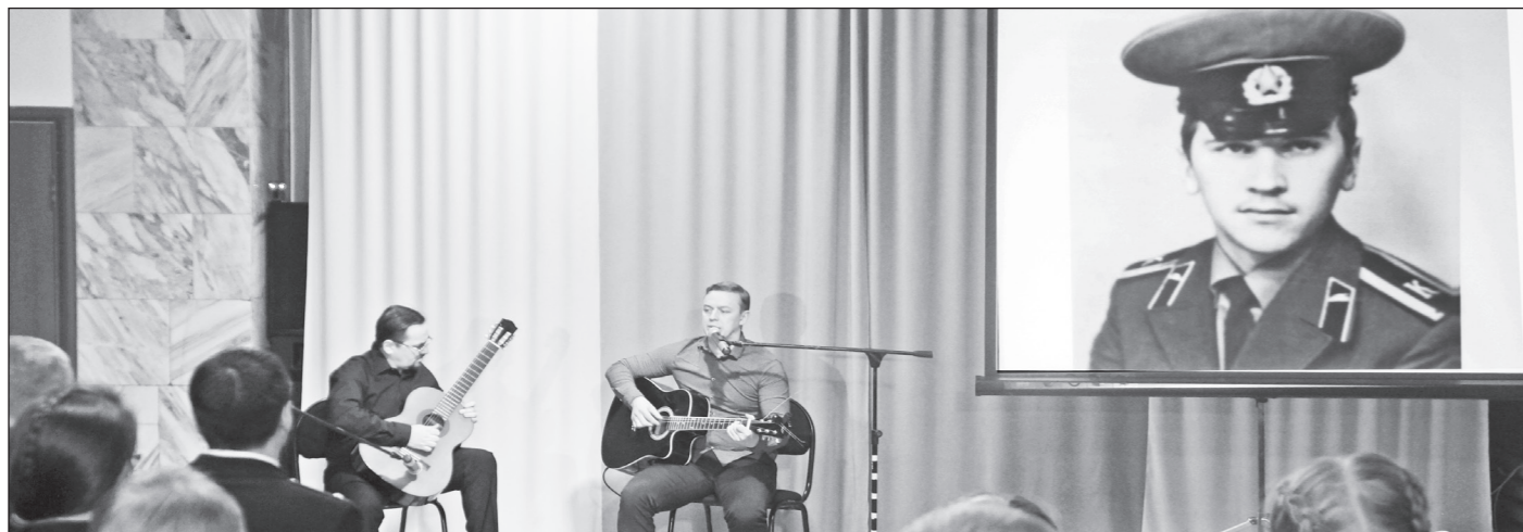
Как всегда, песни и стихи в хорошем исполнении звучали в районном Доме культуры.