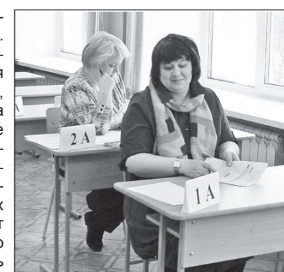
Все было как на настоящем экзамене!

С каждым годом акция «Единый день сдачи ЕГЭ родителями» становится все более популярной. В большинстве своем родители волнуются гораздо больше, чем сами выпускники. Проходя процедуру сдачи ЕГЭ, они начинают понимать, что при соблюдении всех правил ничего сложного в итоговой аттестации нет.