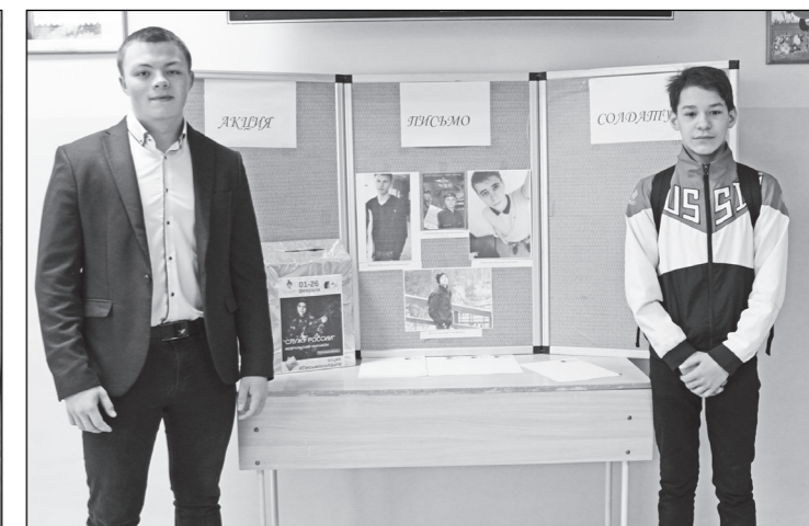
Молодежный центр Туруханского района провел акцию среди учеников средней школы.