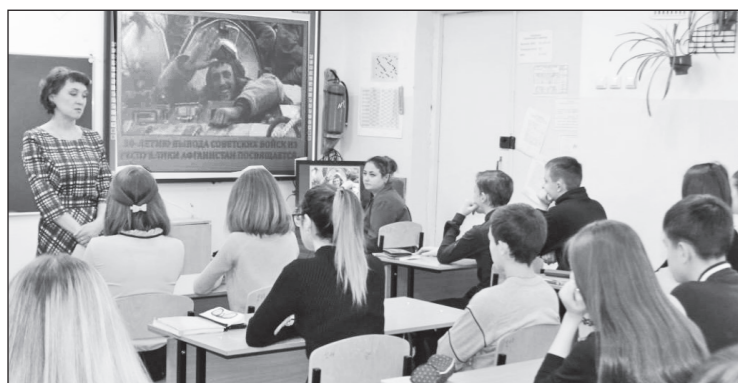
Для старшеклассников в Игарке подготовили лекцию о событиях 30-летней давности.