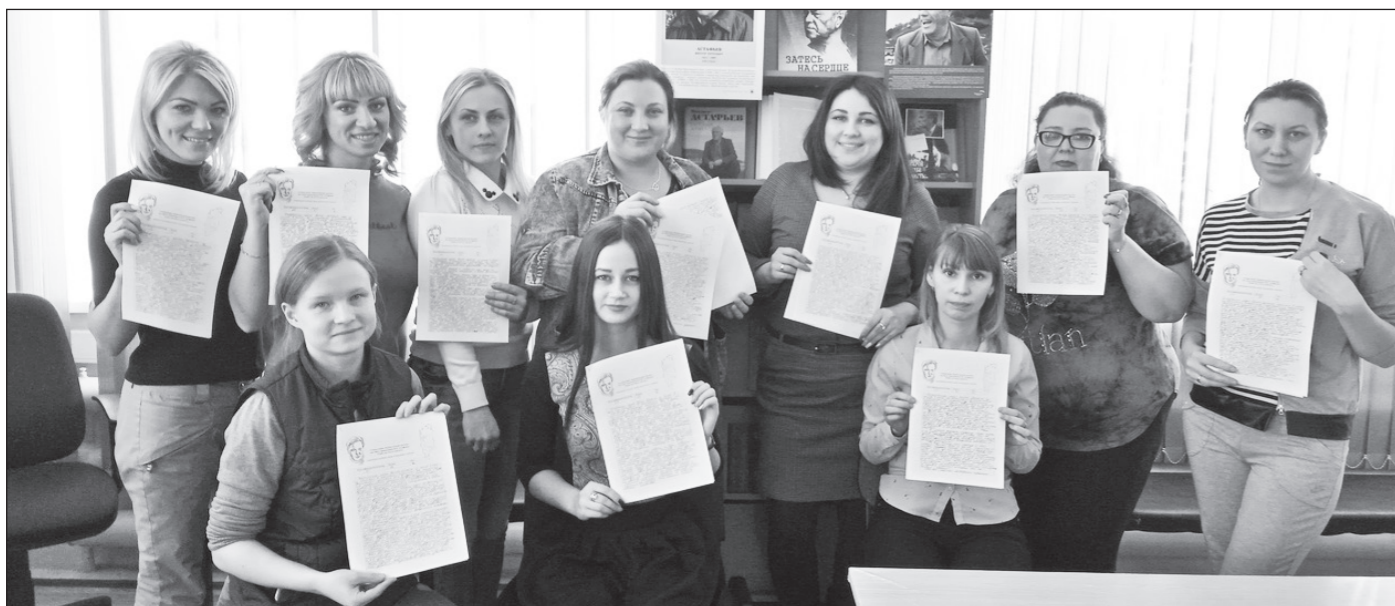
Участники акции «Краеведческий диктант».