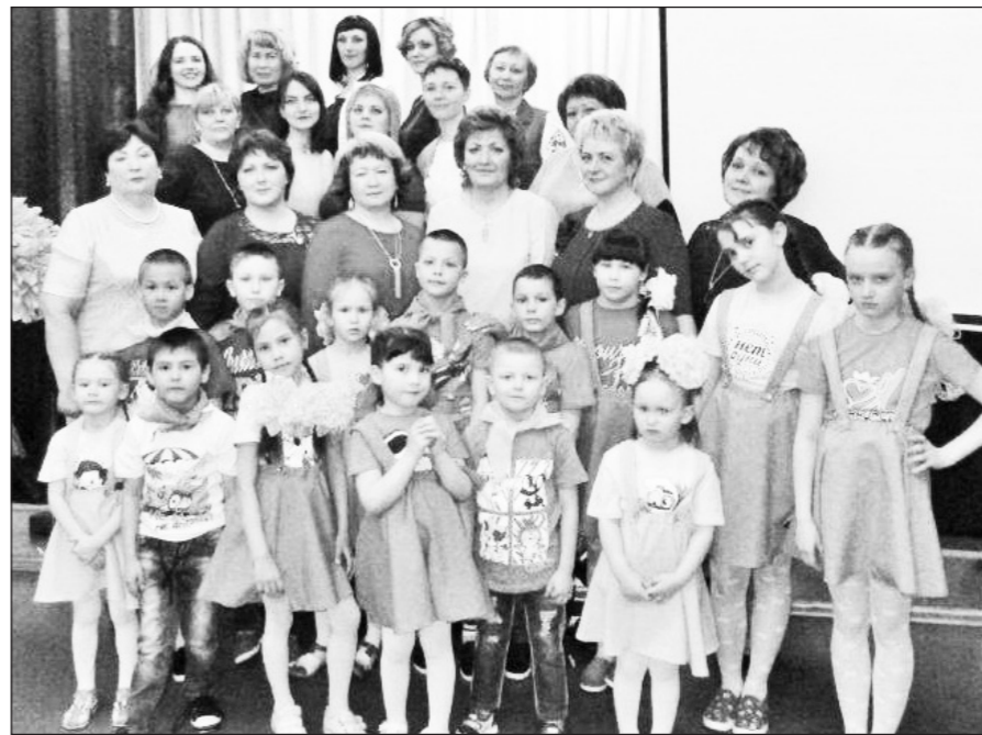
Воспитанники и коллектив приюта – большая дружная семья.

Отдел надзорной деятельности и профилактической работы по Туруханскому району УНД и ПР ГУ МЧС России по Красноярскому краю.