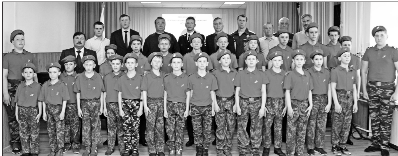
Юнармейцы – будущие защитники Родины!