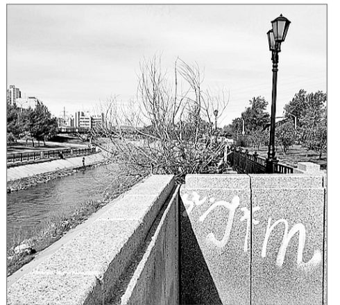
Вандальные надписи просто убивают внешний вид набережных

– Вандализм – трагедия больших городов, рост агрессии, которая выплескивается таким образом жителями, неизбежен. Но мы можем сузить масштаб последствий. Задача состоит в том, чтобы управлять ситуацией, контролировать масштаб проблемы. Есть многолетний