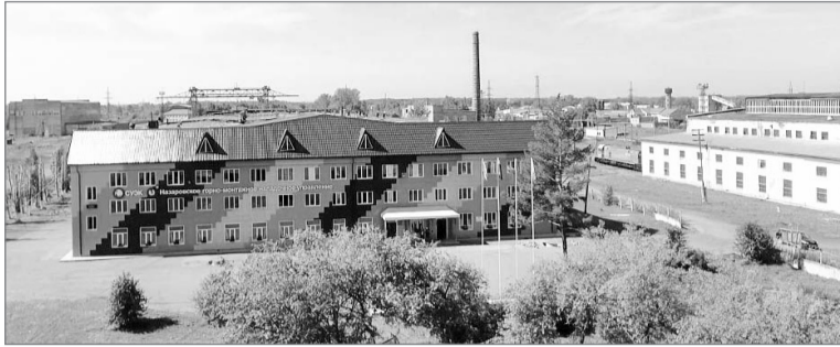
«Уголь России и Майнинг-2019».

С 2017 года НГМНУ изготавливает ковши емкостью 20 м³ для экскаватора ЭШ 20/90. Теперь же назаровским специалистам предстоит освоить производство ковшей объемом 41 м³ для экскаваторов Висугус 495HD, ковша объемом 25 м³ для экскаватора ХРС 2300 и ковша объемом 11 м³ для ЭКГ-10. Первый пробный образец ковша для гусеничного экскаватора ЭКГ-10 планируется представить уже летом этого года на международной специализированной выставке технологий горных разработок