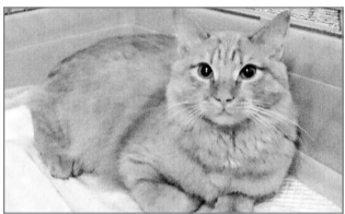
Малышки все еще ищут дом. Отличные охранники. 8-923-353-41-77.

Молодой кастрированный кот. Возраст около 6 мес., к лотку приучен, в еде неприхотлив. 8-923-557-71-01. Привезу.