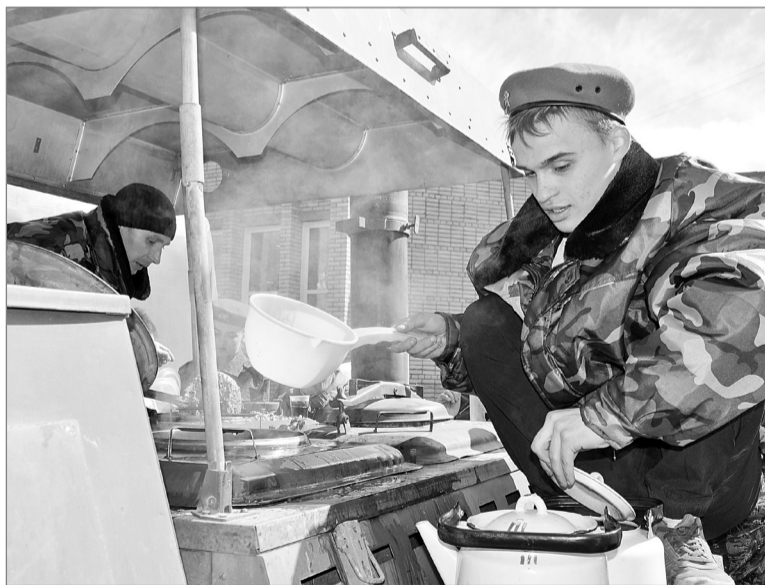
На раздаче - юнармейцы