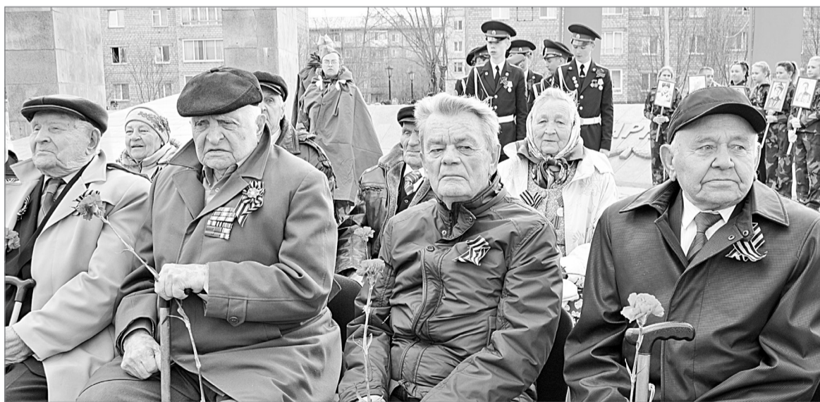
Со скорбью и радостью встречают ветераны 74-ю мирную весну