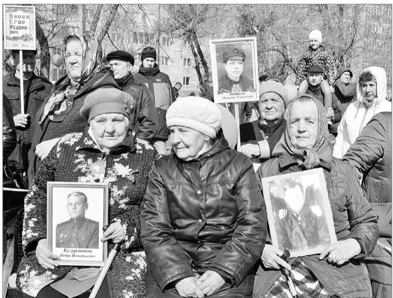
Давайте вспомним годы фронтовые...