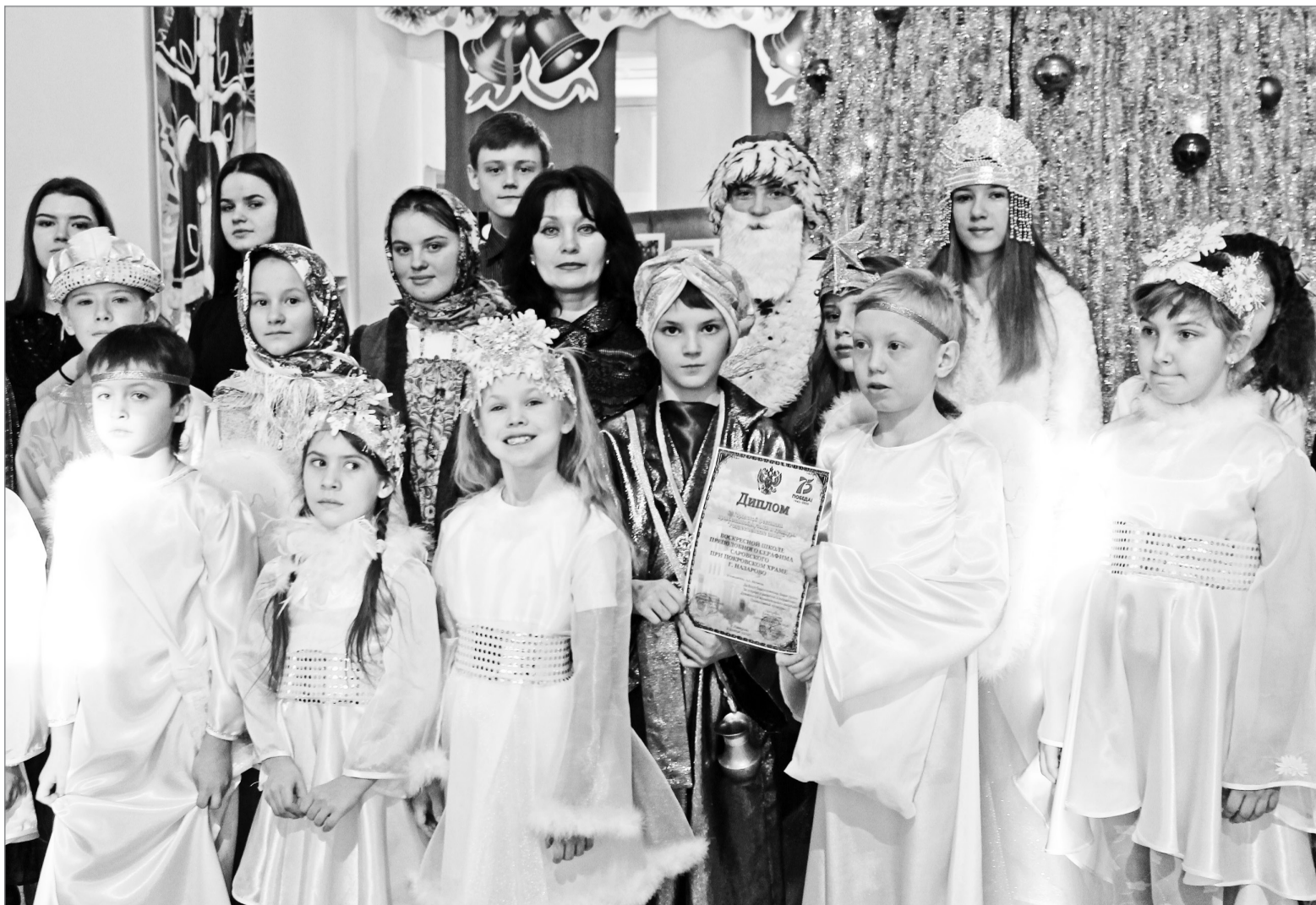
Воспитанники воскресной школы на фестивале «Рождественские звоны»

Следователями и направлено в суд уголовное дело в отношении ранее судимого 42-летнего жителя города. В дежурную часть обратилась 71-летняя жительница и сообщила, что неизвестный из её сумки похитил кошелек, в котором были деньги и банковская карта. Он видел, как пенсионерка рассчиталась в аптеке за лекарства и убрала кошелек в сумку. Воспользовавшись тем, что за ним никто не наблюдает, - похитил кошелек. Подозреваемый задержан. За данное преступление максимальное наказание в виде лишения свободы сроком до 5 лет. «Держите сумку перед собой, тесно прижав к себе и не теряя её из вида, будь то в общественном транспорте, либо находясь в магазине или в других людных местах», - советуют стражи порядка.