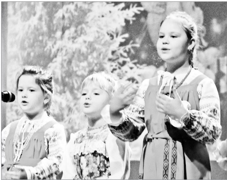
Коляда от «Русского сувенира»

Праздник Рождества Христова приходит тихой поступью после Нового года. Ведь рождение ребенка, Бога- младенца, – особое событие, чудо, ниспосланное нам с небес. Вот уже 12 лет в Назарово проходит фестиваль «Рождественские звоны», поддерживающий и развивающий православную культуру и музыку.