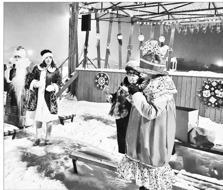
Праздник в Южном

28 декабря состоялось открытие главной городской елки