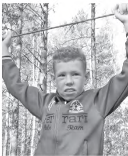
Юные новониколаевцы учатся побеждать

Страницу подготовил Стас ОСМОЛОВСКИЙ.