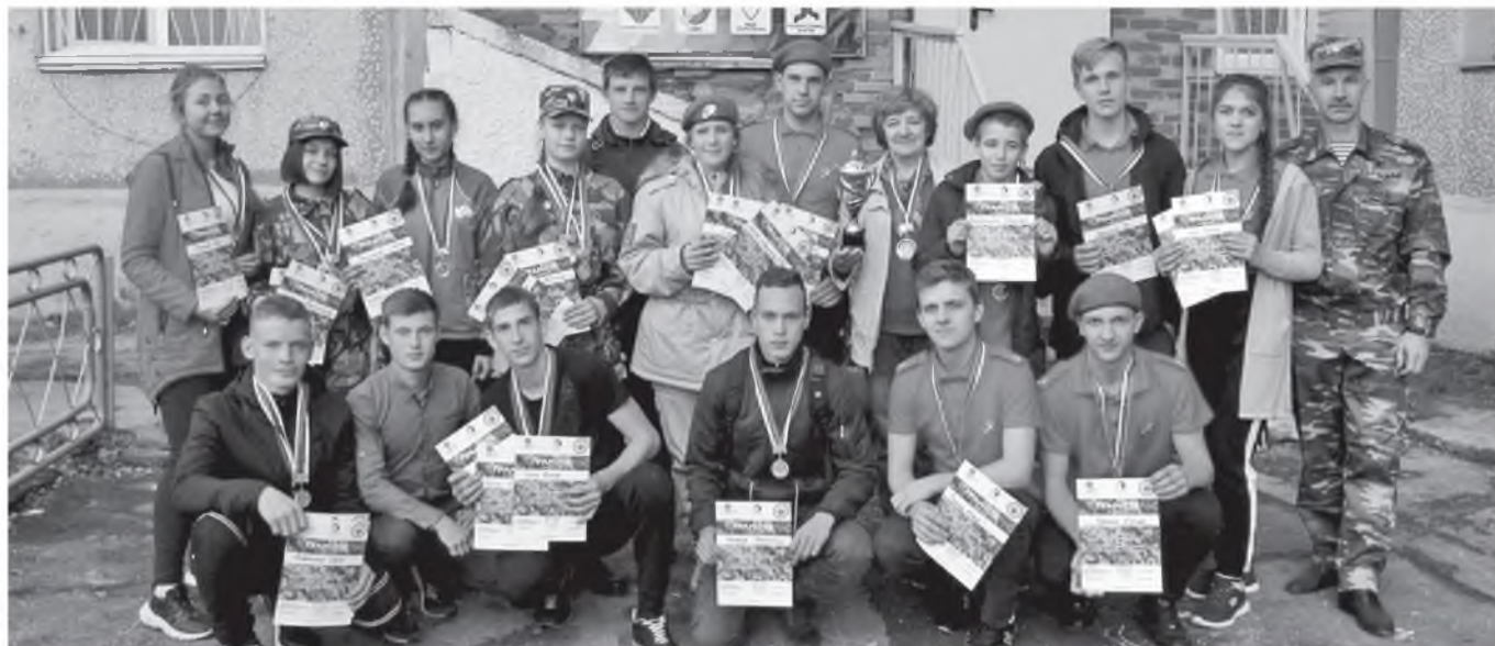
«Гвардейцы» - наша гордость