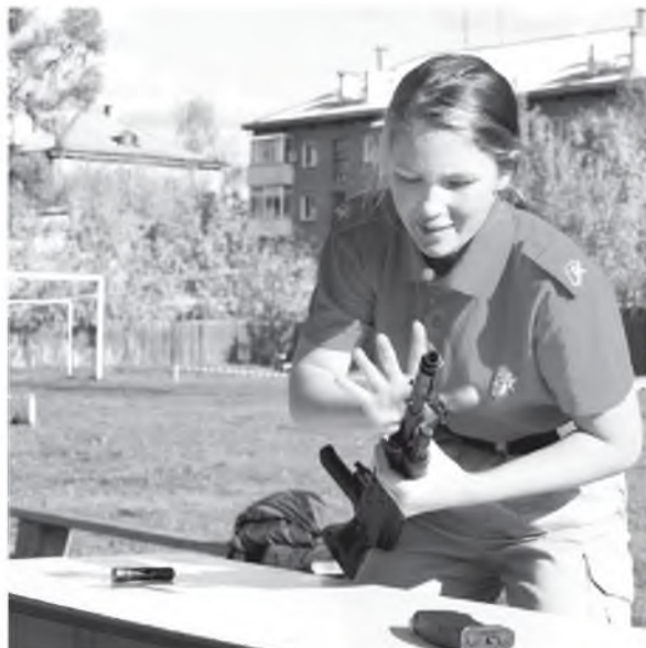
Автомат послушен девичьим рукам