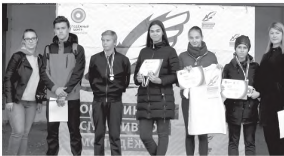
Активные участники фестиваля «Здоровый»

Зональный этап соревнований состоится уже 17 октября в городе Канске.