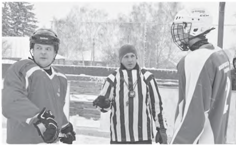
Судья всегда прав