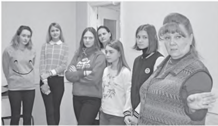
Знакомство с работой редакции

Журналисты газеты «Иланские вести», вдохновившись опытом коллег, решили выйти с предложением к руководству управления образования создать в районе похуже единое информационное пространство на страницах районки, привлекая творческие ресурсы юных авторов из школ района.