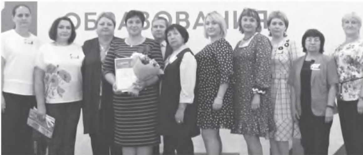
Делегация Иланского района

23 августа в Красноярске прошел традиционный краевой Августовский педагогический совет.