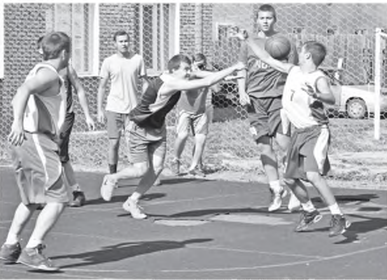
Острый момент игры

Но обо всем по порядку. Дело в том, что в племени «Там-там» на острове Лимпопо заболел вождь аборигенов, пришлось звать доктора Айболита. Доктор с микстурами бросился на помощь больному. По дороге он «лечил» ребят, сидящих в зале, мерил им температуру и давал советы. И, наконец, доплыв до острова, незамедлительно приступил к лечению вождя. А с другой стороны острова, на берег высадились пираты. Предводитель пиратов Крюк и его помощники искали по карте сокровища. Но аборигены напали на них и хотели съесть. И если бы не доктор Айболит, то... В общем, пираты с Айболитом предложили ребятишкам поиграть. Пираты показывали разные игры, а ребята с удовольствием помогали им. После выполнения многочисленных заданий, вождь согласился