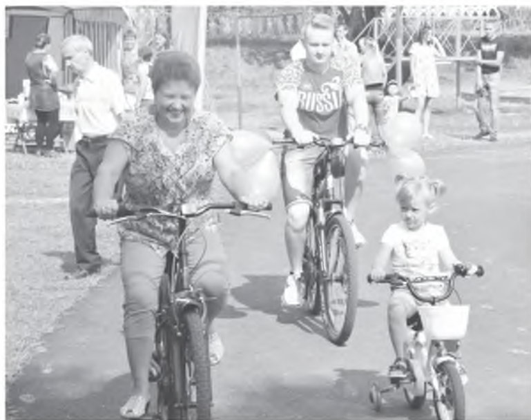
Участники спортивного парада