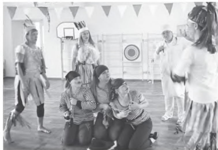
Айболит спешит на помощь

Вот и подошло к концу лето баскетбола, но ребята не расстраиваются, ведь впереди будет еще много ярких захватывающих турниров.