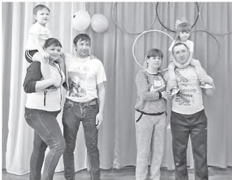
Папа, мама, я - спортивная семья

Участники, болельщики собрались в празднично украшенном зале. Под торжественную музыку в спортивный зал были приглашены участники двух команд. После яркого и эмоционального представления все семьи ринулись в «бой». Командам были предложены интересные, иногда очень непростые конкурсы с мячами, кольцами. Командам даже пришлось продемонстрировать свои навыки в хоккее, футболе, а хоккейная эстафета с мячом стала одной из самых захватывающих. От избытка энтузиазма участники стали одной из самых захватывающих. От избытка энтузиазма мячи порой улетали довольно далеко от намеченного курса. Все этапы соревнований проходили в напряженной борьбе.