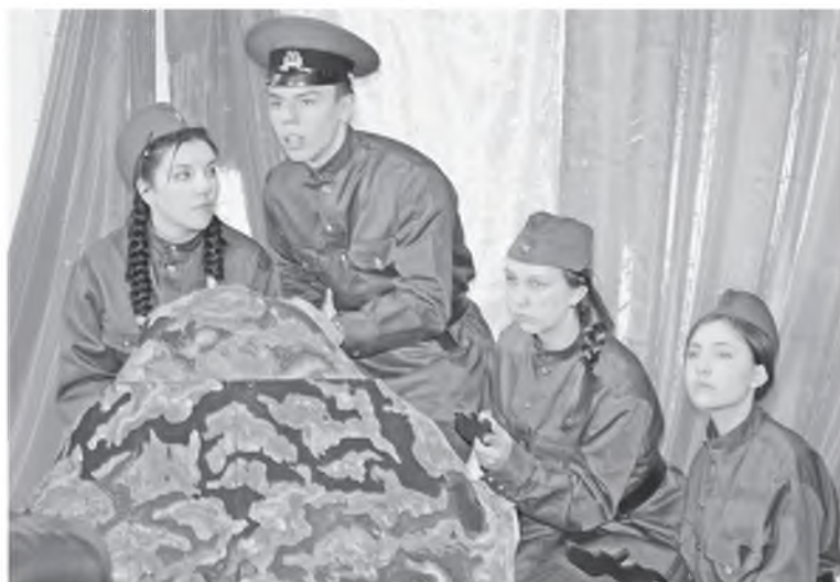
Юные актеры 9 А класса

Возглавлял авторитетное жюри известный режиссер Владимир Абакановский. Он дал высокую оценку многим постановкам,