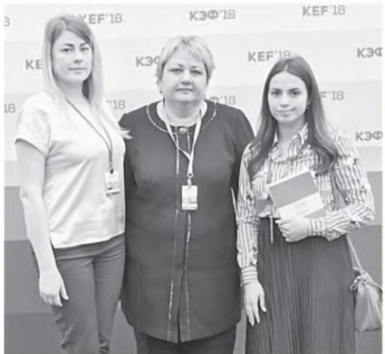
Делегация Иланского района