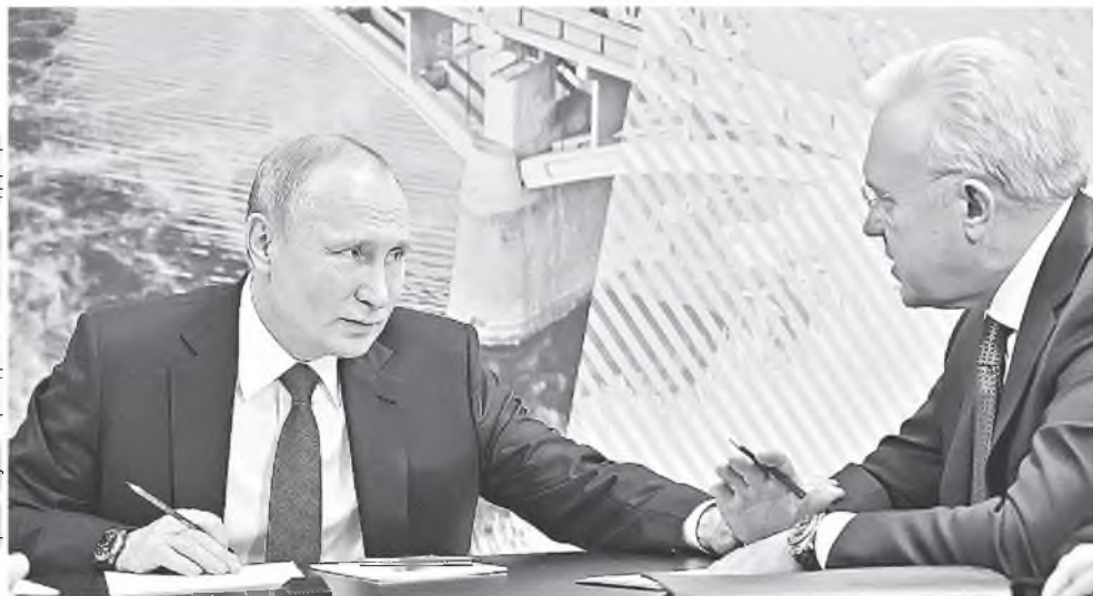
Визит президента России в Красноярск. Февраль 2018 г.