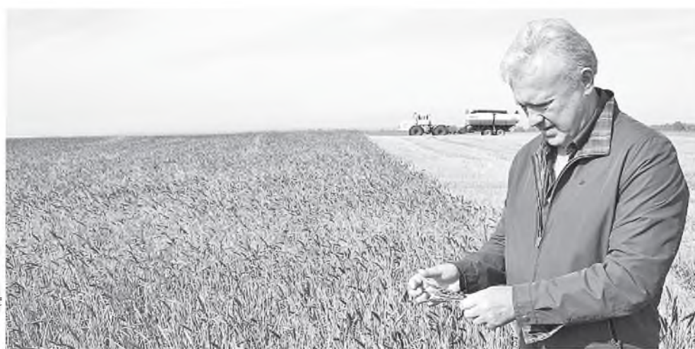
Выезд на поля – обязательный пункт рабочего графика