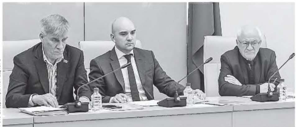
МАТЕРИАЛЫ ПОДГОТОВЛЕНЫ УПРАВЛЕНИЕМ ПО ИНФОРМАЦИИ И ОБЩЕСТВЕННЫМ СВЯЗЯМ ЗАКОНОДАТЕЛЬНОГО СОБРАНИЯ КРАСНОЯРСКОГО КРАЯ