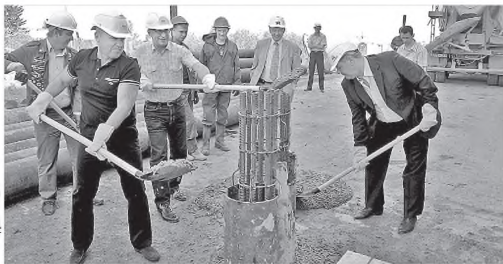
Начало строительства нового общежития СФУ. Июнь 2011 г.

помню эту страницу. Зовут: Усс, иди, твоя очередь! Беру билет и вижу: «Восстание Болотникова». Я говорю: «Можно буду отвечать без подготовки?» – «Почему?» – «Я так хочу, чтобы не забыть». Так вот мне повезло. Правда, с немецким языком у меня были большие проблемы, но это уже было не так важно. Зато потом мне его в жизни пришлось выучить очень хорошо.