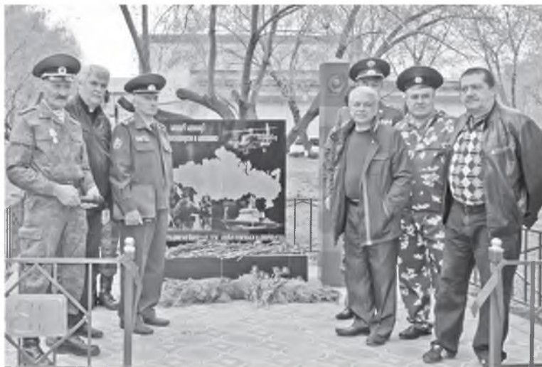
У памятного знака героям-пограничникам

Вы сумели с достоинством и честью пройти огонь боёв и дым пожаров. Вы знаете цену мужской дружбе, закалённой в огне. Вы помните, как тяжелы потери». Наступает торжественный момент открытия памятника.