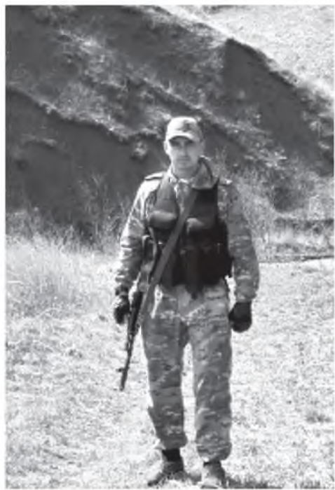
В горах Кавказа.