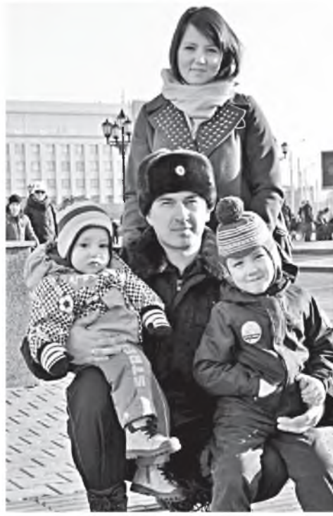
Семья. Нет ничего ее главнее.

— Я считаю, что в любой профессии, которая была бы мною избрана, я себя чувствовал бы хорошо. Ярче проявились бы другие качества, и, наверняка, были бы достижения. Но по полиции я бы скучал.