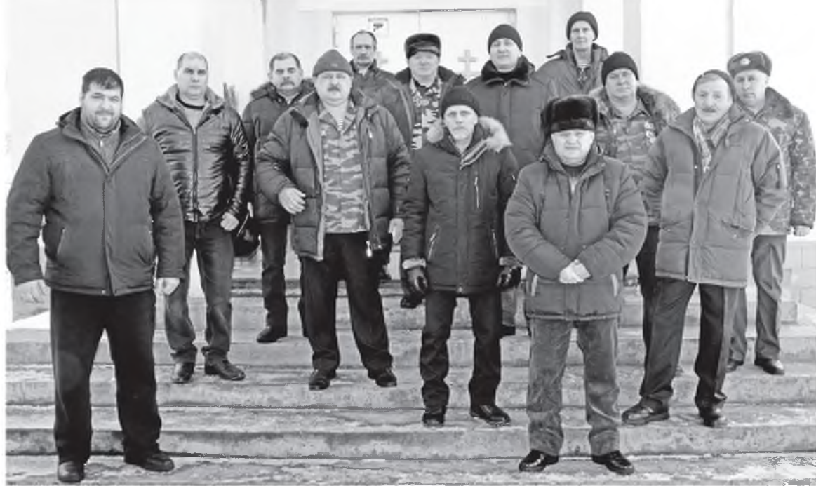
Ветераны локальных войн.

В субботу, 15 февраля, в районном центре прошли мероприятия, посвященные Дню памяти о россиянах, исполнявших служебный долг за пределами Отечества.