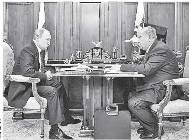
Глава государства в беседе с Игорем Сечиным особое внимание уделил арктической теме

Игорь Сечин пообещал это сделать. Чем, мне кажется, сейчас занимаются и в краевом правительстве – чтобы обеспечить в проекте максимальное количество наших, красноярских специалистов, загрузить заказами предприятия региона. Такой шанс выпадает, пожалуй, раз в столетие.