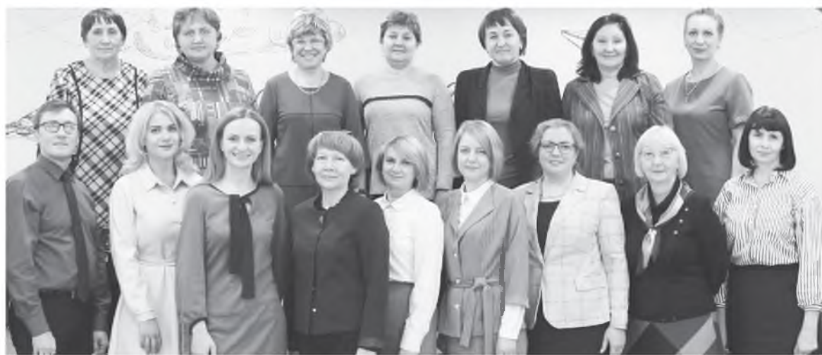
Участники краевого совещания.

Открытие модельной библиотеки в посёлке Урал стало событием не только для местных жителей, но и всего Рыбинского