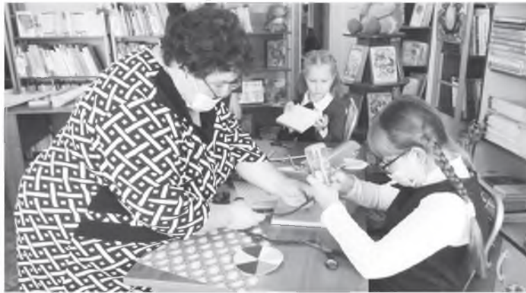
Творческий проект - «Скрапбукинг»