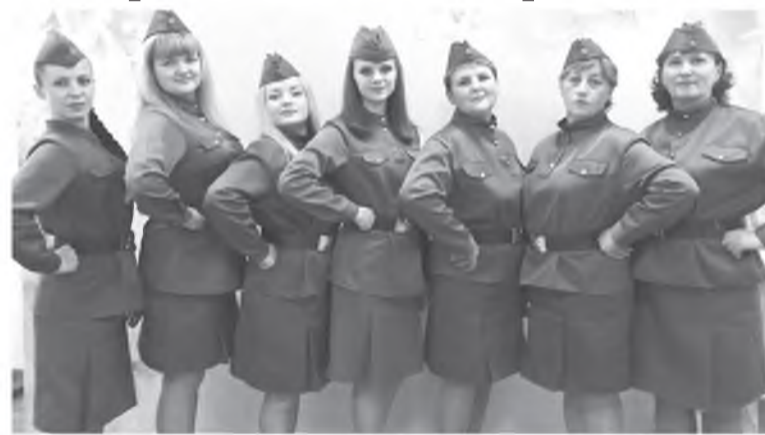
Вокальная группа «Жемчужина»

8 октября в Городском Дворце культуры города Канска состоялся конкурсный концерт межмуниципального этапа фестиваля «Творческая встреча».