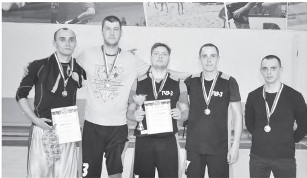
Победители турнира «Локомотив» (ТЧЭ-3)

В последней встрече турнира сошлись два претендента на чемпионство. Обе команды с первых секунд задали высокий темп и агрессивную игру в обороне, что привело к большому количеству ошибок и неподготовленных бросков. «Локомотиву» первому удалось почувствовать ритм игры и приспособиться к нему. Постепенно они развили своё преимущество до «+10», что для многих зрителей означало начало разгрома. Но «Отряд» не собирался просто так отдавать