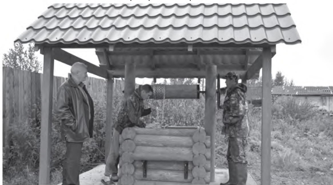
Возле гавриловского колодца.