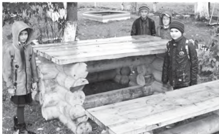
Сквер в центре Южно-Александровки.